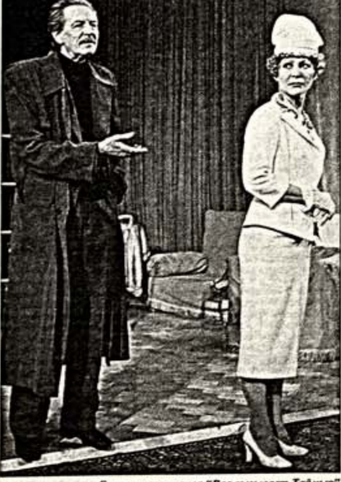
Сцена из спектакля "Лас опять вызывает Таймыр"