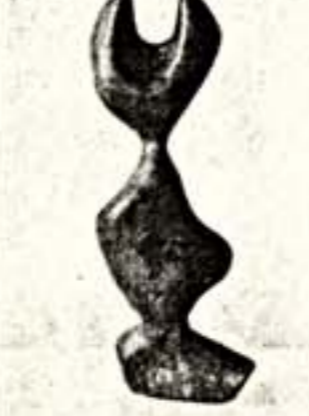
Э. Бушон. "Чертунок"

Выставка Нины Геллинг и Эккахарта Бушона "Под крестом"