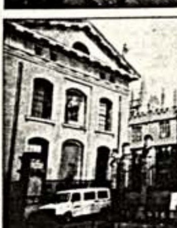
В городе Оксфорде