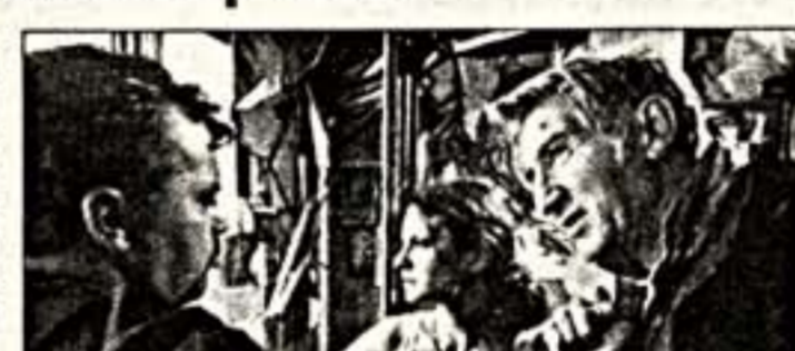
Вверху: кадр из фильма "Небесная удочка" (Югославия).