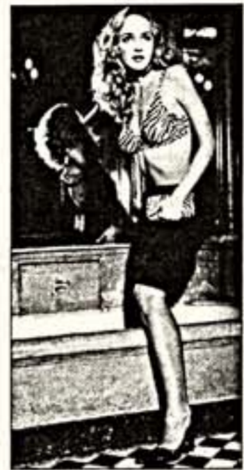
Элен де Фужероль