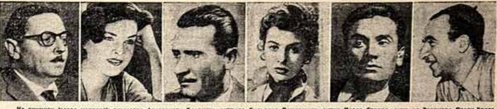
На снимках (слева направо): режиссер Алессандро Блазетти, антриса Сильвана Пампанини, актер Паоло Стоппа, антриса Элеонора Россин-Драго, актер Массимо Джиротти, режиссер Альберто Латтуада.

Известный итальянский кинорежиссер, архитектор по образованию, работавший журналистом, редактором и журналистом в журналах «Ла рота», «Фронтиспиччи» и «Корренте». Накануне вступления Италии в войну Латтуада организовал в Милане фестиваль классических фильмов, среди них была показана «Венуша илюзия» Ренуара, что в то время было актом большого мужества. В 1942 году Латтуада становится первой партияемостотельным фильмом «Джамомо» Виктора Эммануэля, занимает видное место среди режиссеров