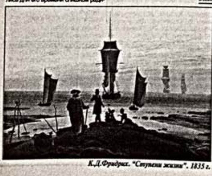
К.Ф. Фридрих. "Ступени жизни". 1835 г.

В Эссене, как и в других городах Германии, проходят выставки его картин. В Эссене, как и в других городах Германии, проходят выставки его картин. В Эссене, как и в других городах Германии, проходят выставки его картин.