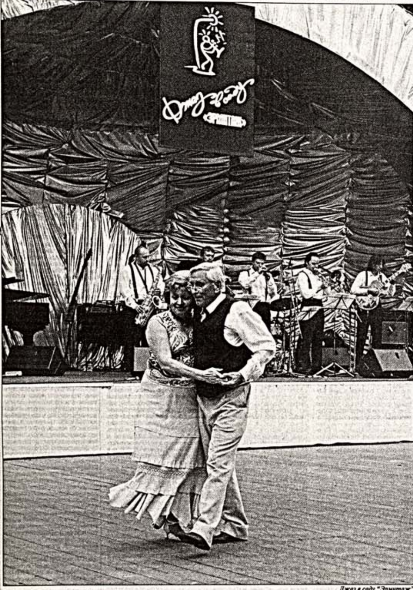
Джаз в саду "Эрмитаж"

Завершился Девятый международный фестиваль "Джаз в саду "Эрмитаж"