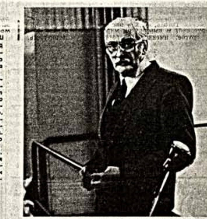
ДЕСЯТЬ ЛЕТ СПУСТЯ

Единственное спасение от этой политики, войн, разрухи — заглянуть в свою воображаемую пещеру дал и спорить там без остатка. Иного пути нет.