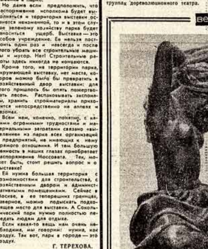
вехи советской классики