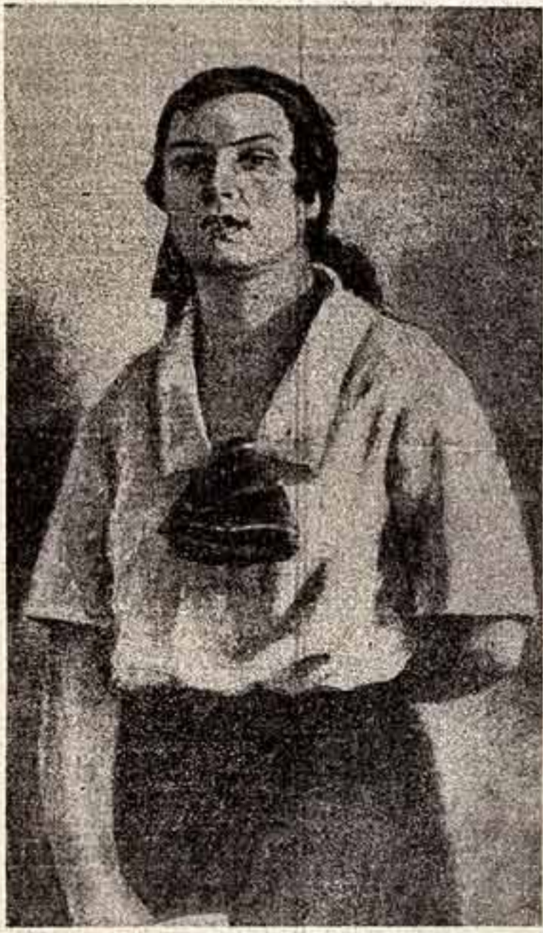
Г. Рансой. «Делегатам», 1927 г.

В ТЕЧЕНИЕ наступившего юбилейного года на страницах нашей газеты будут воспроизводиться достойнейшие из многих и многих творений полувекковой истории советского искусства — полотна живописцев, скульптуры, графики, кадры кинофильмов, сцены из спектаклей. Пусть фотографии, которые мы будем помещать из номера в номер, напомнят читателю о тех ценностях, которые накопились в нашем искусстве за все его пятьдесят лет. Сегодня — место художникам: публикуются произведения разных лет, разных мастеров, ставшие памятью большого пути.