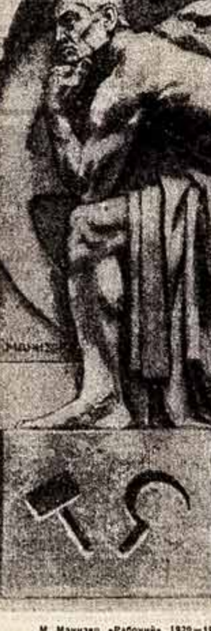
М. Маннер. «Рабочий». 1920—1921 годы.