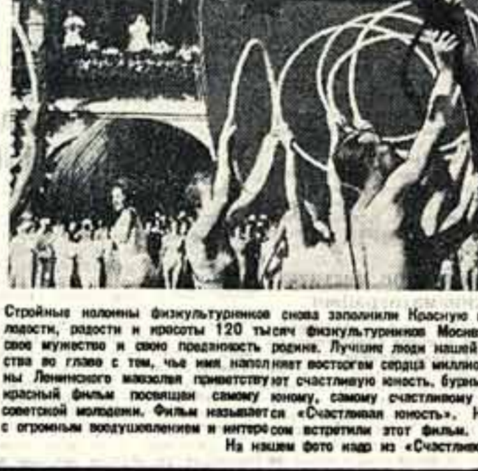
Стройные колонны физкультурников снова заполнили Красную площадь. Под звуки оркестра с песнями молодости, радости и красоты 120 тысяч физкультурников...