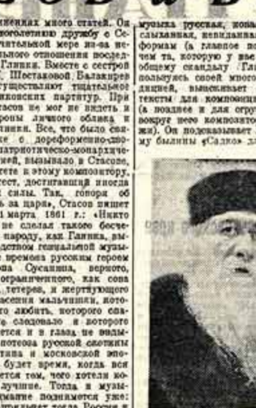
М. А. Балакирев. Фрагмент портрета работы И. Е. Репина