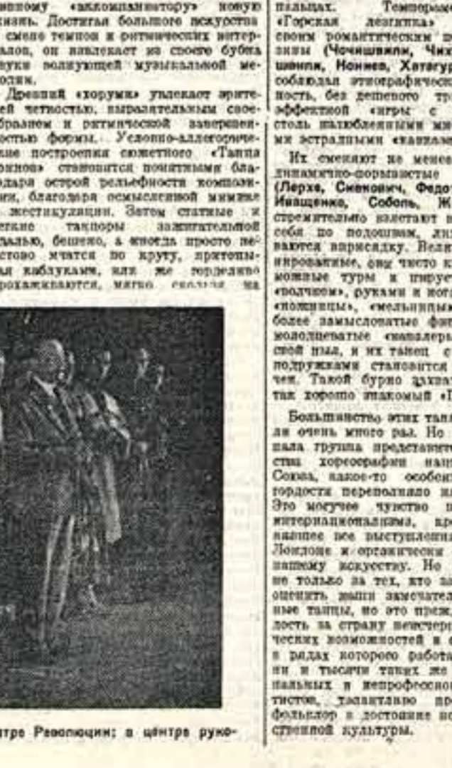
Группа советских участников Международного фестиваля на сцене в театре Ревю...