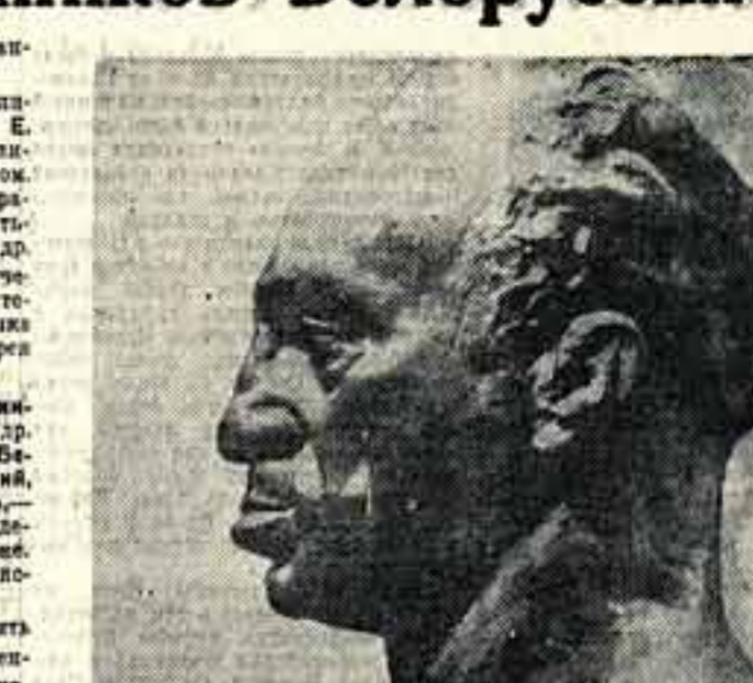
А. М. Бразер

Оптимистическая революция прервала экономически и национально угнетенную партию Белоруссии в мощную, орденосную индустриально-колхозную страну.