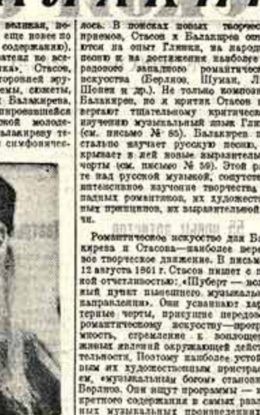
М. А. Балакирев. Фрагмент портрета работы И. Е. Репина