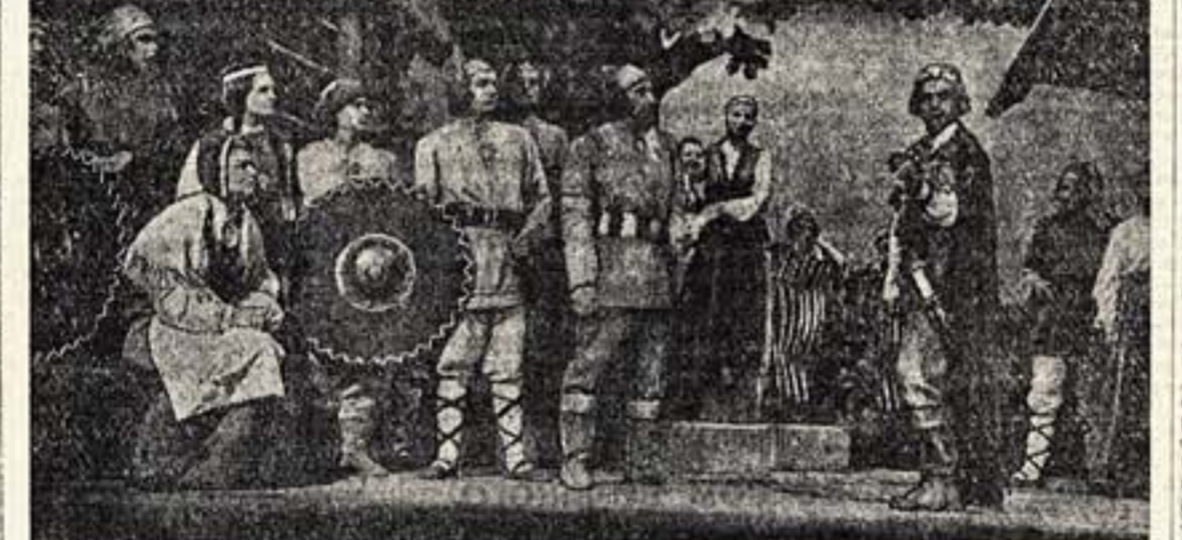
Театр Юного зрителя Латвийской ССР поставил пьесу «Орлеан» — из героического прошлого латвийского народа. На снимке: сцена из 1-го акта пьесы.

В странах Европы, освобожденных от фашистской оккупации Красной Армией и войсками союзников, советские фильмы пользуются большой популярностью. Советские фильмы показываются в освобожденных странах демонстрационно — «Она защищает Родину», «Радуха», «Фронтовые подруги», «Мальчишка», «Секретарь райкома», «Два бойца», «Небо Москвы» и многие другие произведения советского киноискусства.