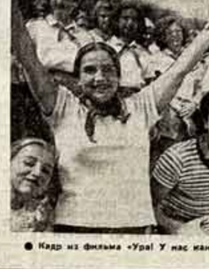
Кадр из фильма «Ура! У нас инкукулы».