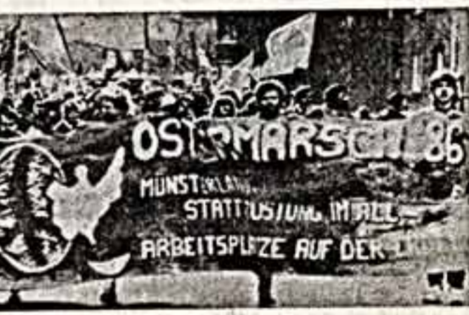
С разными континентах приходит сообщения в массовых выступлениях трудящихся в защиту мира, против антимарксистской политики правящих кругов капиталистических стран, за социальный прогресс и демократизм. По всей ФРГ состоялась традиционная весенняя митинг мира, проходившая в этот год под знаком борьбы против участия Западной Германии в американской программе «авиационных войн». Демонстранты в городе Мюнстер несут плакат с требованием: «Свобода вооружений в космос — рабочая места на земле!». Танков «свобода слова» в Чили: этот фоторепортер пытается сфотографировать демонстрацию протеста против режима Пиночета.