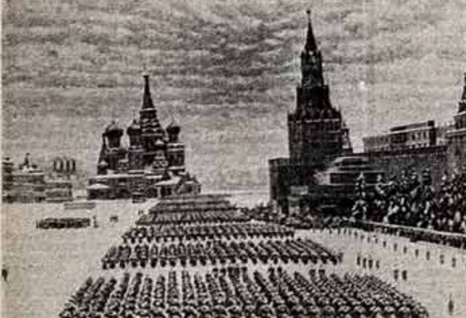
К. ЮОН. «Парад на Красной площади 7 ноября 1941 г.»