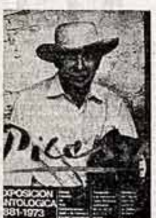
В музее современного искусства в Мадриде проходит выставка произведений испанского художника Пабло Пикассо...

Д. ДЫМОВ, корр. ТАСС — специально для «Советской культуры», БЕЛГРАД.