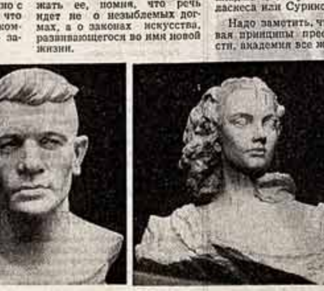
Н. Томский. «Волоградский рабочий».