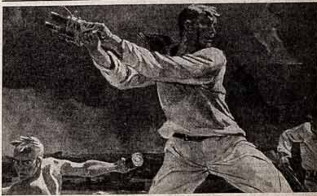
А. Дайнека. «Оборона Севастополя» (фрагмент).

Искусство мастеров академии столь значительное и емкое в своем содержании по тому, что оно рождено всем строем советской культуры, Идеи, которые руководили художниками при создании этого искусства, прекрасны и общенародны. Общественная польза этого искусства неизмерима, поскольку в высокохудожественных образах здесь представлена вся наша жизнь в ее динамичном развитии, и это искусство является собой творческим художникам летопись величайшей в истории человечества эпохи.