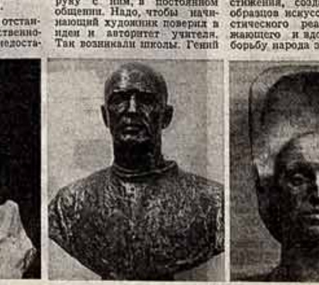
С. Коненков. «Марфишка».