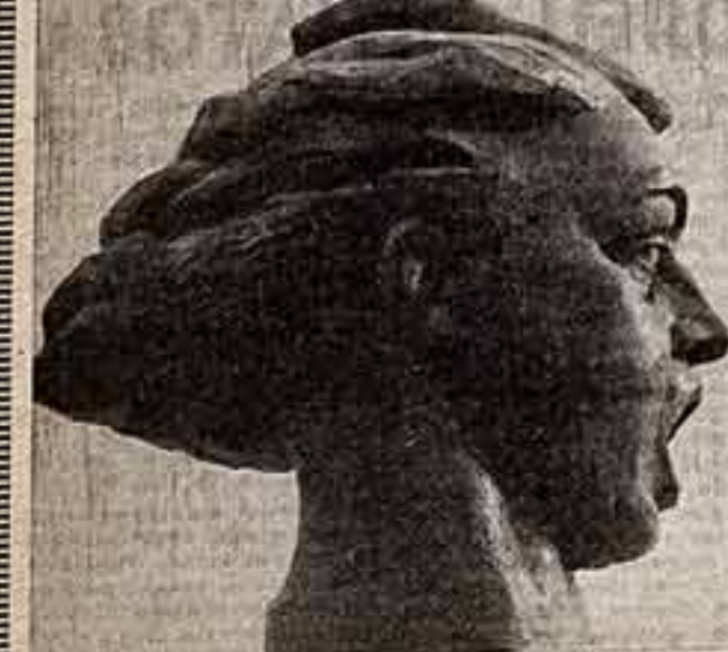
Е. Вучетич. «Родина-Мать зовет».

Академия художеств борется за искусство и за богатство художественной индивидуальности во творчестве, подчиненного единой цели — построению культуры коммунизма. Не усидя наравленные к унижению напело художественного богатства. И в борьбе с модернистской антикультулой, о разлагающем влиянии которой мы не должны забывать, победоносного художественной индивидуальности во творчестве, подчиненного единой цели — построению культуры коммунизма.