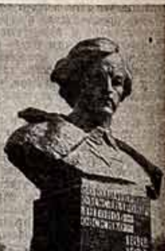
Помните В. А. Антонова-Овсенню в Аллее Героев в Чернигове.

дипетера для воспитания детей, не создали необходимых условий для внеклассной работы с детьми в школах и по месту жительства. 3 декабря 1973 года бюро Новосибирского горкома КПСС, рассмотрев этот случай, определило целый ряд мер по совершенствованию воспитательной работы в учебных коллективах, усиление требований к педагогическим кадрам, возложению роли в трудовых коллективах, общественной и нравственном воспитании учащихся. Во всех учебных заведениях это чрезвычайно своевременное и важное мероприятие вызвало всеобщую озабоченность, проведены педагогические советы, собрания учащихся и преподавателей по расширению внеклассной и внешкольной работы и улучшению патриотического воспитания. Управление профессионально-техническим образованием в соответствии с ПТУ за право попасть в число неуспевающих в школу или в институт. Славян. Работники просвещения, профессионально-технического образования и административные органы, допустившие серьезные упущения в работе с подростками, привлечены к строгой партийной ответственности. Итак, Новосибирская история заставила задуматься о воспитании подростков, повысить уровень партийной ответственности за них. Надо всегда помнить, что формирование марксистско-ленинского мировоззрения, выработка идеино-политических взглядов, норм коммунистической морали — это центральная задача идеологической работы всех партийных организаций. Партийные организации, руководители предприятий достаточно вели работу по повышению ответственности ро-