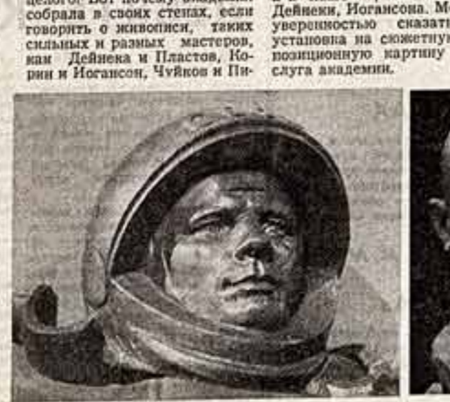
И. Кербел. «Первый космонавт».