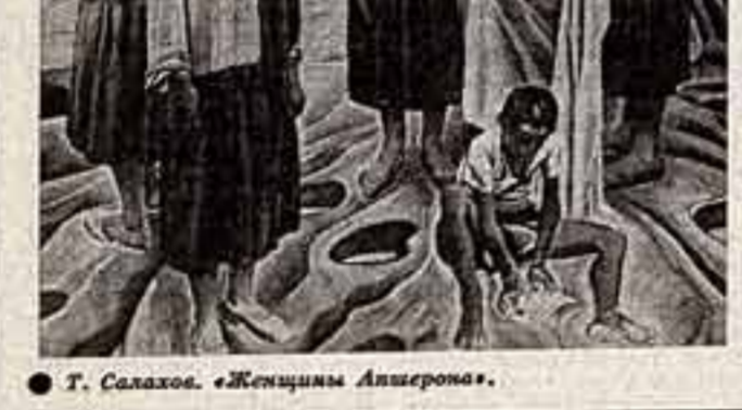
Т. Салахов. «Женщины Алжера».

Не менее впечатляющие и монументальные памятники-комплексы с их символическими образами, установленные скульпторами академии и память о битвах, героизме и трагедии советских людей.