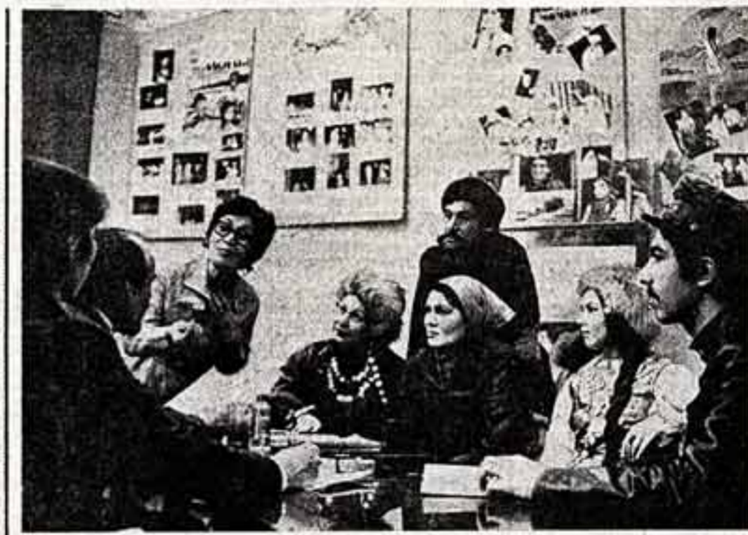
Популяр в башкирском городе Нефтекамске народный театр. В коллективе более 60 человек, это рабочие, служащие, учащиеся. Артистов театра в выходные принимают в городах и селах республики, а также и за ее пределами.