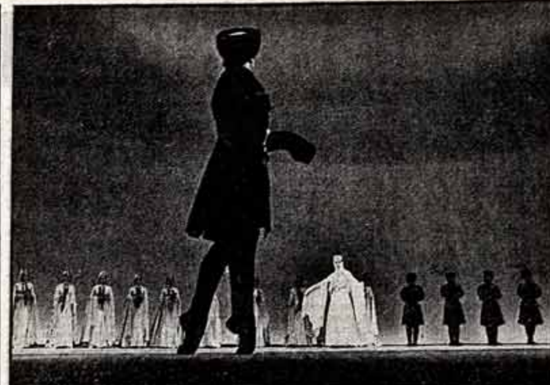
А. СААКОВ. «Грузинский танец».