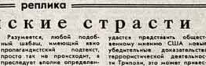
В. РЕТШИЛОВ, корр. ТАСС — специально для «Советской культуры», Нью-Йорк.

В юности, играя в театре Э. Ф. Бурмана, я чувствовал себя совершенно счастливым. Но в глубине души возмущался позать и кино. Прими с практической стороны, — продолжал В. Меншиков. — Бурманские актеры любили и поэтому считали предательством переход актера в другое место. Он не выносил актерских отступлений от текста и собственного раздумия.