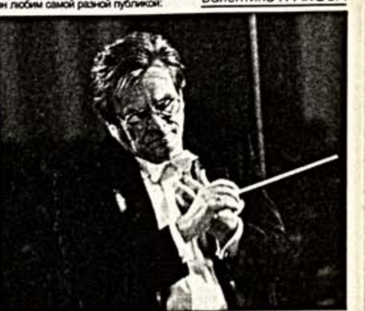
Владимир Федосеев за дирижерским пультом

Но самыми главными Федосеев считает для себя концерты в России. Пожалуй, никто из дирижеров такого уровня не выступает сегодня так часто на родине. Возможно, поэтому сегодня в России он любим самой разной публикой: