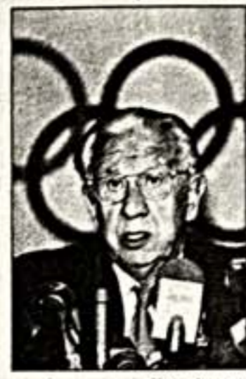
Хуан Антонио Самаранч