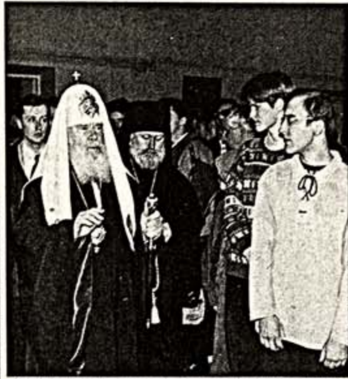
Зенон колоколов и торжественные песнопения в домовой церкви Московского университета...

На вопрос: "Какое событие минувшей недели вы считаете самым интересным?" - отвечают наши эксперты - столетние и региональные журналисты.