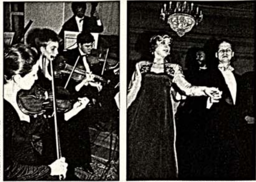
Российский фонд культуры (РФК) решил в этом году присоединиться к числу организаций, которые принимают непосредственное участие в праздновании...