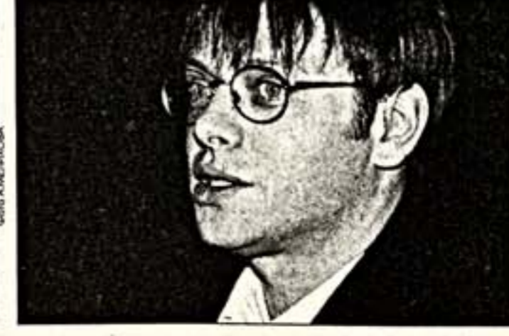
Слева: Кинолюбитель страны Александр Абдулов в окружении дам. В центре: Актриса Юлия Рутберг (Театр Вахтангова) и Роман Виктюк. Справа сверху: Дина Корзуна с "Золотым Оном" в руках и Сергеем Безруковым нараву, а не в бебе. Справа внизу: Валерий Тодоровский - всеми любим и непобедим