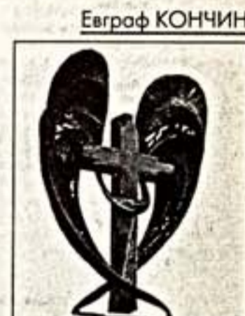
"Вознесение". 1996 г.