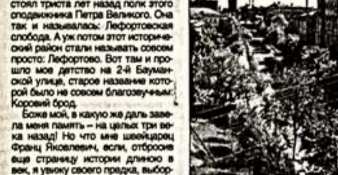
3-я Бауманская улица, бывший Королев брод