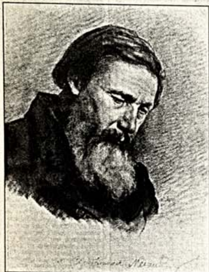
Слева: И.Крамской. "Мужской портрет". В центре: К.Маковский. "Два натурщика". Справа: И.Репин. "Портрет Е.П.Сухомыровой-Летковой"