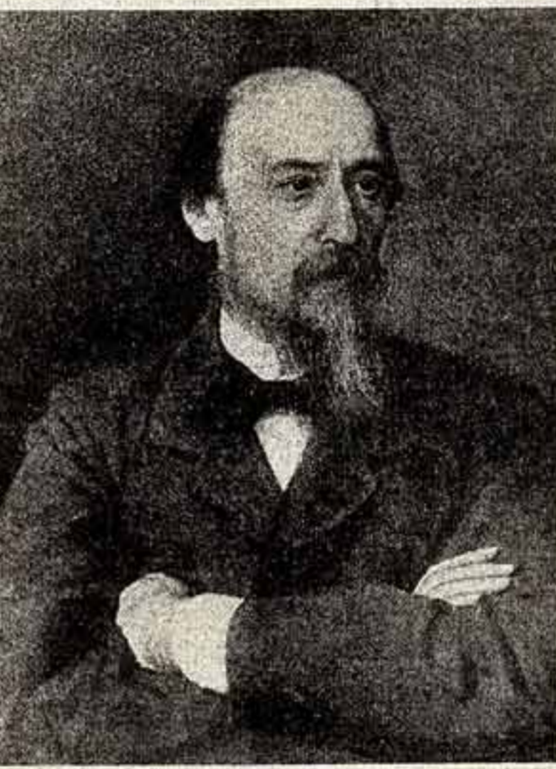
150 лет со дня рождения Н. А. Некрасова

рода, за социалистическое воспитание людей, особенно молодежи, за безопасность России. Соответственно мы должны объективно оценивать потребности общества на данном этапе, вовремя найти наилучшее решение назревших проблем, способ продвигаясь вперед, преодолевать возникающие трудности, пути и формы наиболее быстрого движения вперед — все эти задачи ложатся на правящие коммунистические партии. Задача эти, товарищи, не легкие, но и не невозможные. Даже крайне сложными является само дело построения принципиально нового общества. И решить их можно только на основе великого марксистско-ленинского учения, исходя из проверенных жизнью закономерностей социализма, творчески применяя и развивая революционную теорию в условиях своей страны, опираясь на поддержку всех трудящихся, идя в едином боевом строю с братскими странами социализма.