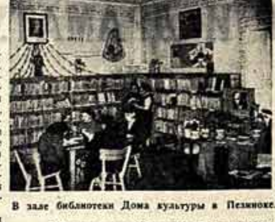
В зале библиотеки Дома культуры в Пезиноке.

За последние годы многое изменилось в жизни крестьян Словакии. Основаны единые сельскохозяйственные кооперативы (ЕСК), где хозяйство ведется по-новому. Перемены коснулись не только экономической, но и в еще большей степени культурной жизни крестьянства. Сегодня нет такого села в Словакии, где не было бы своего кинотеатра, дома культуры, библиотеки или кружка талантов. Вся культурной работой руководят так называемые «Общества беседы» — культурно-просветительные общества.