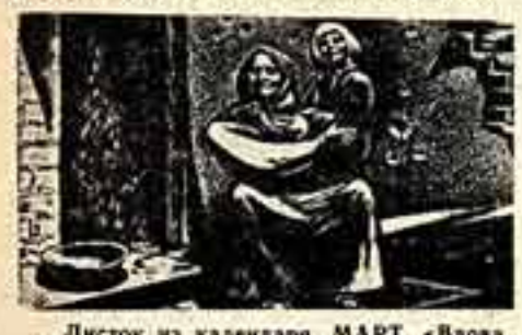
Листок из календаря. МАРТ. «Вдова участника войны с ребенком». Рис. Р. В. Коррелла.