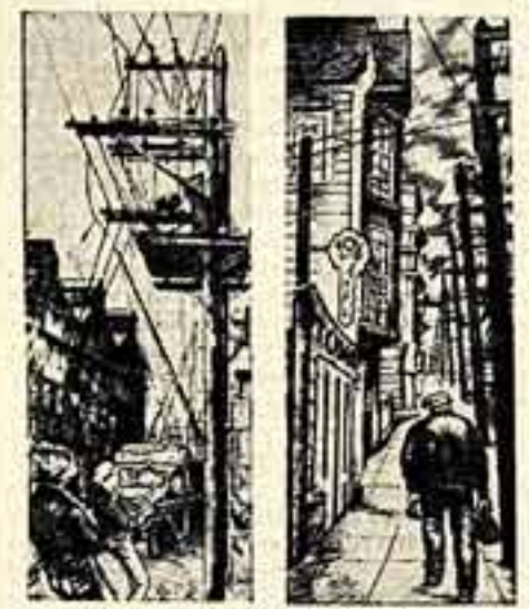
Листок из календаря. ИЮНЬ. «Рабочие». Рис. Битс Хайдем.