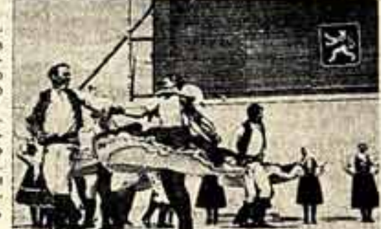
Выступление танцевальной группы Словацкого народного художественного ансамбля.

Словацкий народный художественный коллектив (СЛУК) возник в 1949 году. Построенным его месторезиденцией служит поместье бывшего графа Лайана в Руговцах, около Братиславы.