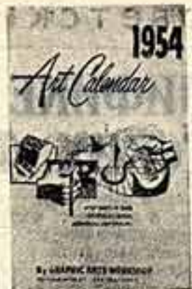
Обложка «Художественного календаря» на 1954 год, выгравированная «Мастерской графиков» (Сан-Франциско, США).

Образчиком творчества художников, объединившихся вокруг «Мастерской графиков», является выгравированный ими настенный «Художественный календарь» на 1954 год, каждый листок которого иллюстрирован рисунками на актуальные темы. Мы воспроизводим обложку и несколько листков этого календаря.