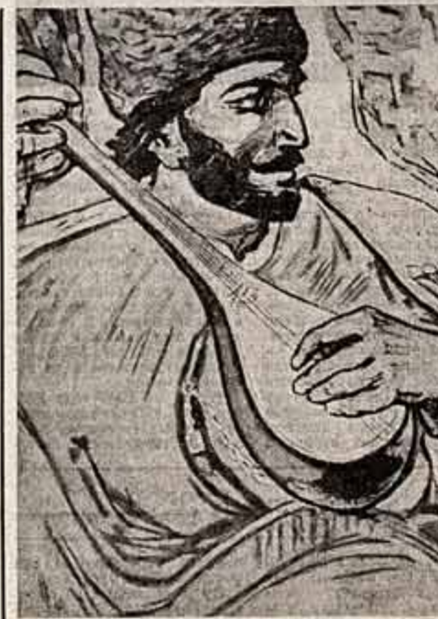
М. Абдуллаев. «Ашуг Алакерт».

Пьесу известного американского писателя Теннесси Уильямса «Ночь Игуаны» показал в Риге Художественный театр имени Яна Райниса. В спектакле заняты народные артисты СССР В. Артмане и Л. Фреймане, заслуженный артист республики Х. Пилелин и другие. Постановщик — главный режиссер театра, заслуженный деятель искусств Латвии Арнольд Липини. Наш спец. корр. РИГА.