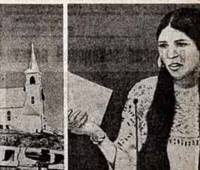
Шашин Маленкое Перо