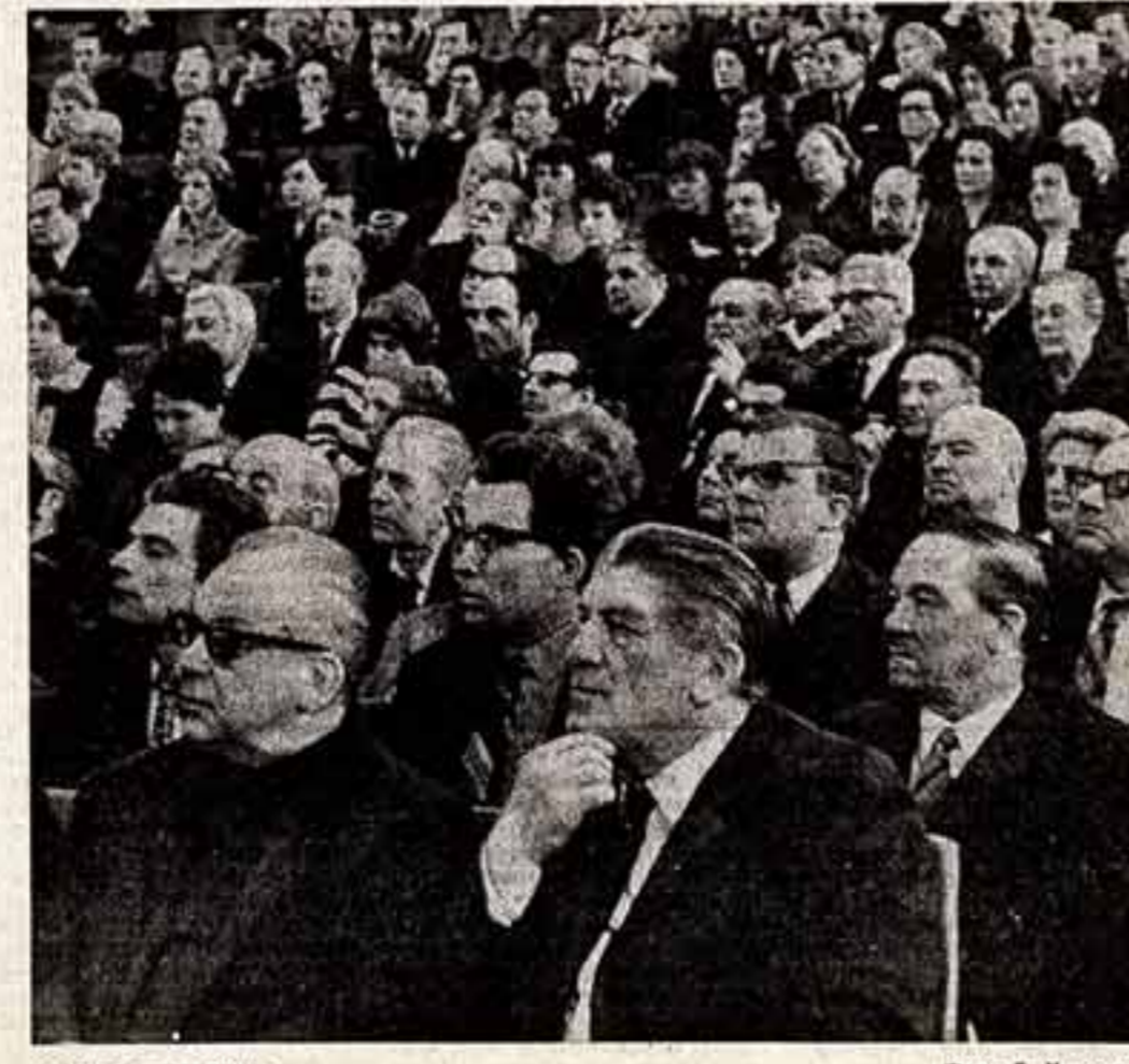
В зале заседания.