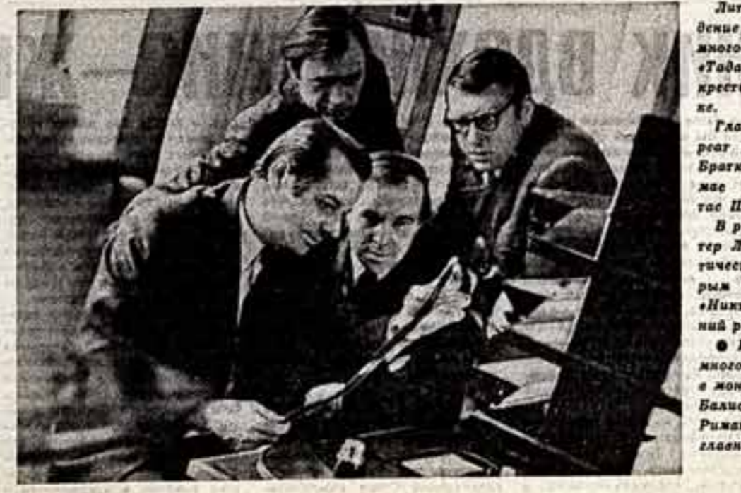
Литовское республиканское телевидение показало первый телевизионный многосерийный художественный фильм «Тадас Влижда» о борьбе литовских крестьян против помещиков в XIX веке.