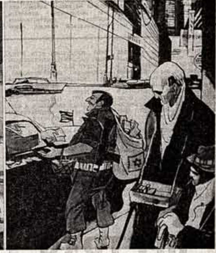
— Приходите, коллега, что мы далеки от планеты.