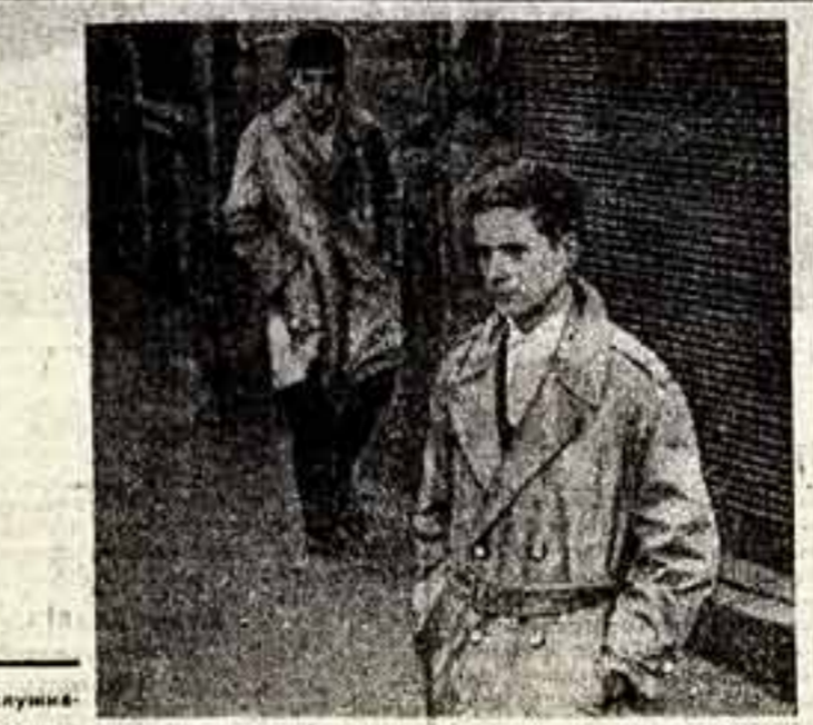
Кадр из фильма «Журналист» и «Отец», заслуживших высшую оценку жюри фестиваля.