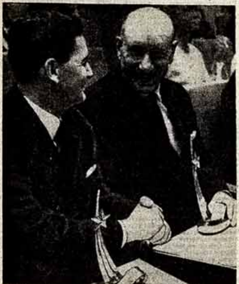
Лауреаты V Московского международного кинофестиваля венгерский режиссер Иштван Сабо — постановщик фильма «Отцы» и народный артист СССР кинорежиссер Сергей Герасимов, автор сценария и постановщик фильма «Журиальте».

РЕШЕНИЕ ЖЮРИ ПО ПОЛНОМЕТРАЖНЫМ ХУДОЖЕСТВЕННЫМ ФИЛЬМАМ Золотой приз — фильму «Журиальте» (СССР) и «Отцы» (Венгрия). Золотой приз — специальная премия жюри — фильму «Отключение» (Болгария). Золотой приз за лучший фильм молодой развивающейся кинематографии — фильму «В седьме не звезда» (Перу). Серебряный приз — специальная премия жюри — фильму «Роман для корнета» (Чехословакия).