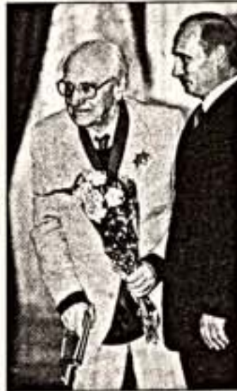
В.Путин вручает орден "За заслуги перед Отечеством" Б.Покровскому