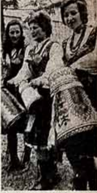
Сценика в Польше трудно найти город или деревню, где бы не было энтузиастов, отдающих свободное время кинематографу, танцам, изобразительному искусству. Пожилая женщина объединяет в 23 танцевальных коллективах.

Участники ансамбля народных инструментов из города Лиманов.