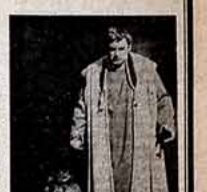
М. ИГНАТЬЕВА, спеч. корр. «Советской культуры»

Гандельс — композитор, музыкант, педагог. Его творчество — это синтез различных искусств. Гандельс — человек, который оставил после себя огромное наследие. Его творчество — это синтез различных искусств.