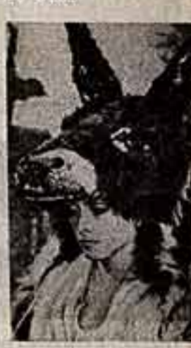
Катрин Денев в сказочной роли. Снимок перепечатан из американского журнала «Ньюсуик».

Имя Жана Демья хорошо известно советскому зрителю по кинокартине «Шерлок Холмс» и французскому фильму этого замечательного режиссера, утверждающего добро, красоту и справедливость, с большим успехом проходит по мировым экранам. Жан Демья остался верен своим традициям и при создании своего последнего фильма, экранной сказки Шарля Перро «Ослиная шкура». Фильм музыкален, поэтичен, красочен. Музыка для фильма написал композитор Мишель Легран. В главных ролях заняты Катрин Денев и Жак Перрен. Сейчас этому фильму аллодируют зрители США.