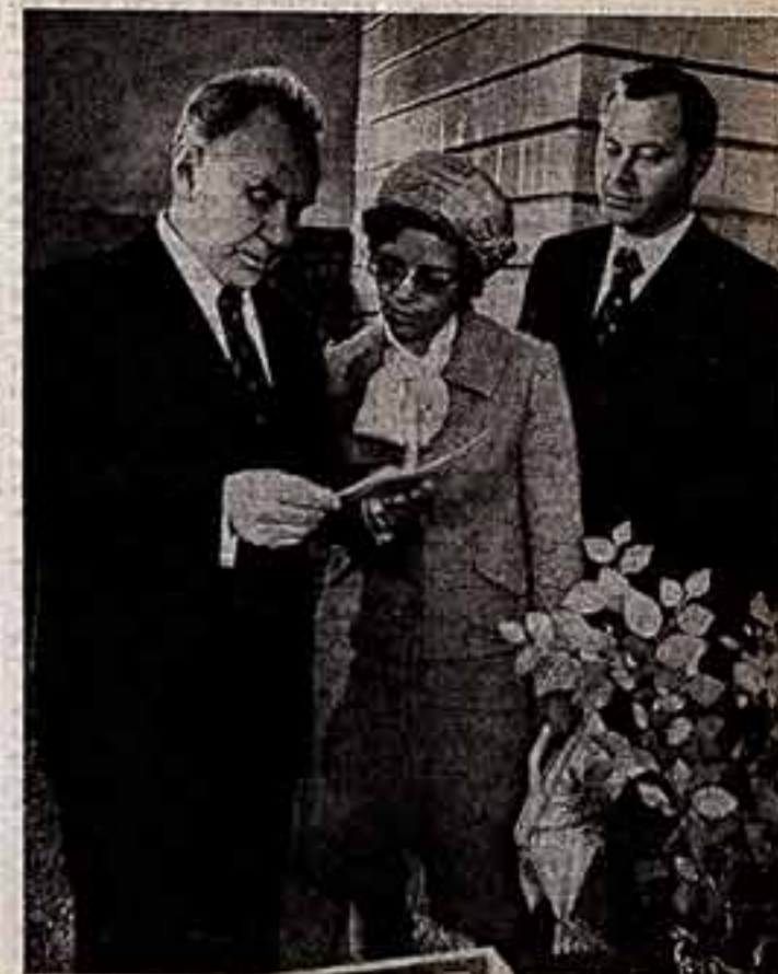
Москва, 15 июня. Товарищи Л. И. Брежнев, Н. В. Подгорный и А. Н. Косыгин на избирательных участках.