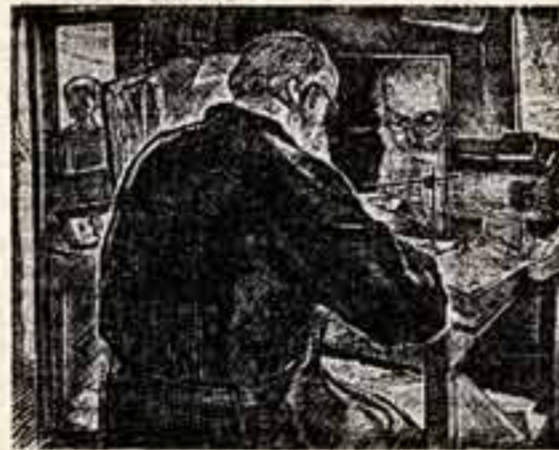
Н. Голцин, «Владимир Андреевич Фаворский».