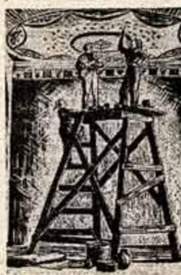
Т. Рейн, «Монументальности».