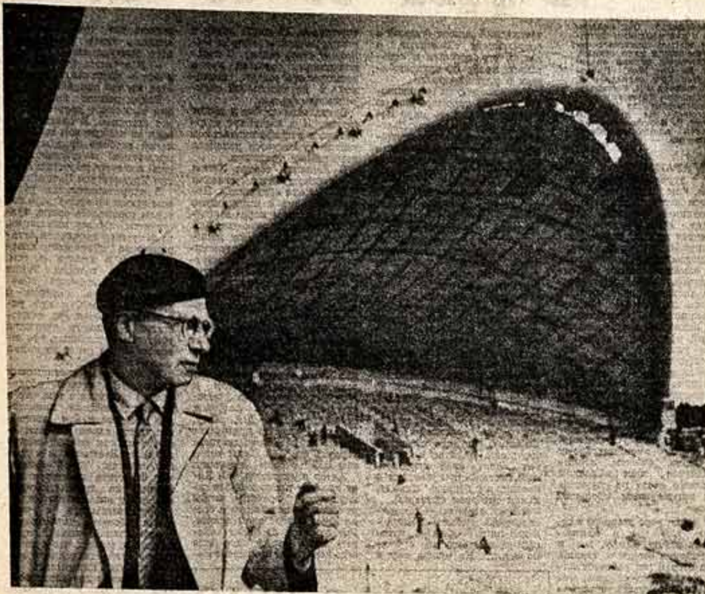
В Мура (Эстонская ССР), идея осуществляется.