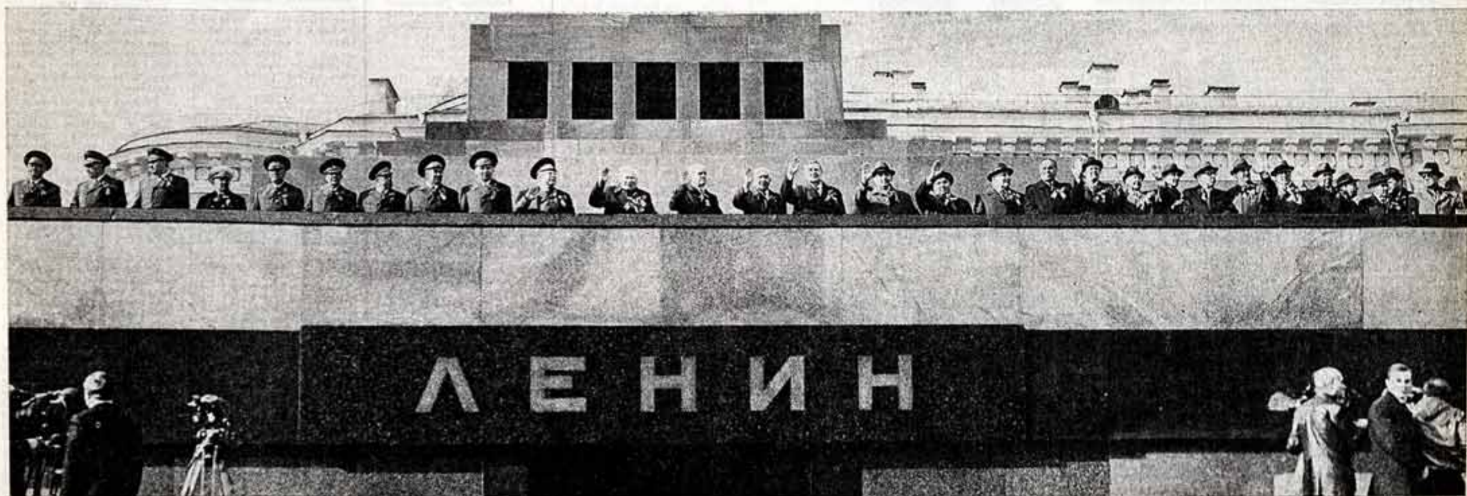
Москва, Красная площадь. 1 Мая 1984 года.