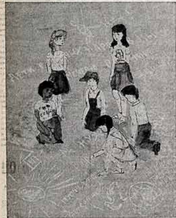
Эти ребята учатся в художественной школе подмосковного города Подольска. Они мечтают стать художниками, людьми самой мирной профессии. О них они думают, за свои рисунками.