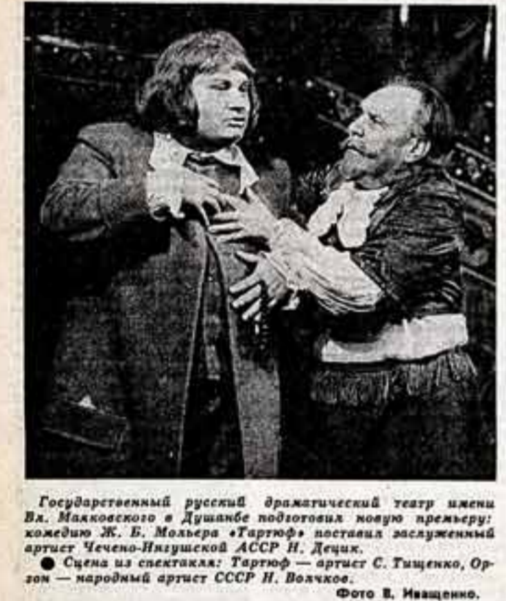
Государственный русский драматический театр имени Ва. Маяковского в Душанбе...