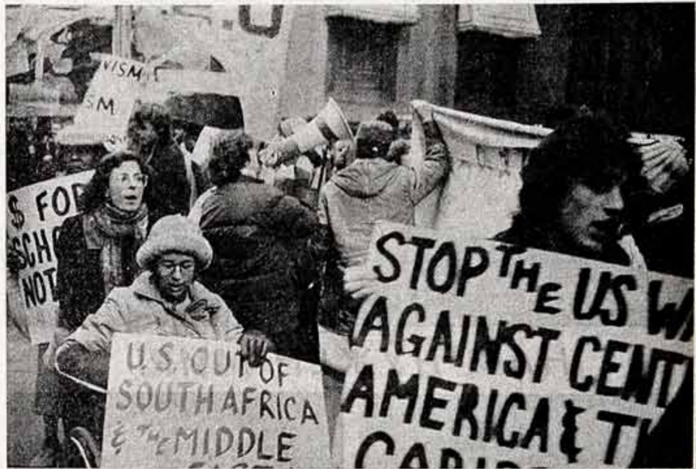
«Нет — американскому вооружению в Центральной Америке!»... Участники манифестации.

Советский Союз вновь указал на необходимость возврата к политике мирного сотрудничества, отвечающей интересам международного сотрудничества.