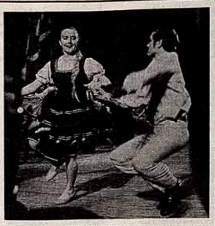
Ю. КЕЛЬДИН. «Мир звуков» и «Донская плеска»