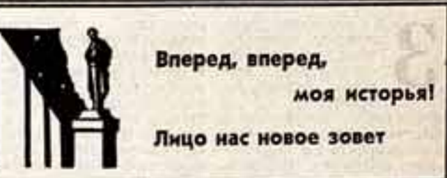
Вперед, вперед, моя история! Лицо нас новое зовет