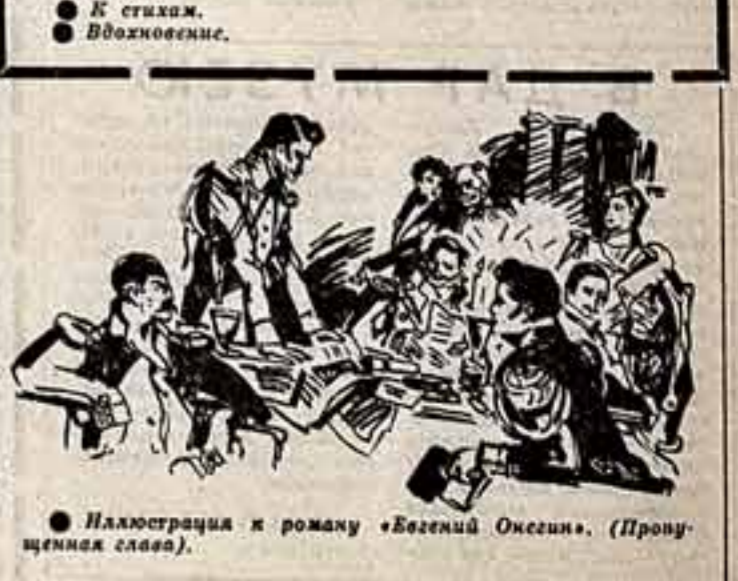
Иллюстрация к роману «Богемий Онегин». (Пронув-ценная глава).

«Словом о Пушкине» можно назвать новый цикл работ В. Горлова, заслуженного художника РСФСР, лауреата Государственной премии СССР. Автопортреты художника посвящены поэзии великого поэта. Они экспонируются сейчас в Центральном доме литераторов.