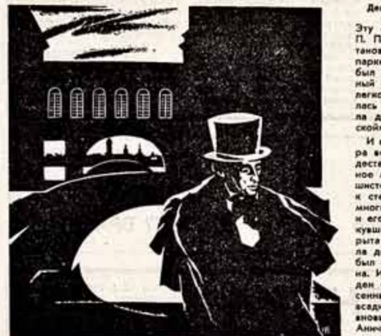
Гравюра Н. ЕРЕМЧЕНКО.