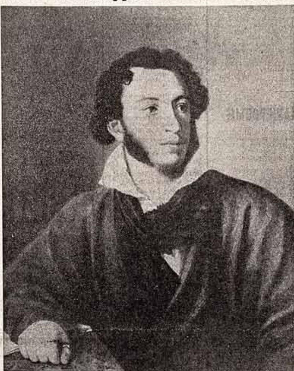
В. Тропкин. (1827 г.)

Мне кажется, для того чтобы понять, что такое Пушкин сегодня, надо оставить Россию, читающую поэта при его жизни, с внешней современной Россией, увидеть ее ребенка первоклассника с книжкой «Сказка о царь Салтане» до всех возрастов, склонившихся над страницами его произведений. Это можно представить, но невозможно охватить взглядом. Я видел, как идут люди и Пушкин в день его рождения. С раннего рассвета, после краткой белой ночи и дождя по всем дорогам и тропам, ведущим в Михайловское на луг, и до дому над Сорочью. Десятки тысяч людей. Их доставляют поезда, приносят самолеты, привозят автобусы и машины из дальних земель и ближайших городов и сел. От границы Михайловского на опушке бора к дому поэта все они идут пешком, малые и старые. Надо пройти вместе с ними по этой не метафорической, а буквально народной тропе под белыми-голубыми неосновным небом через шум осен, пенки птиц, свет и тени бора, разноголосый говор толпы, чтобы почувствовать