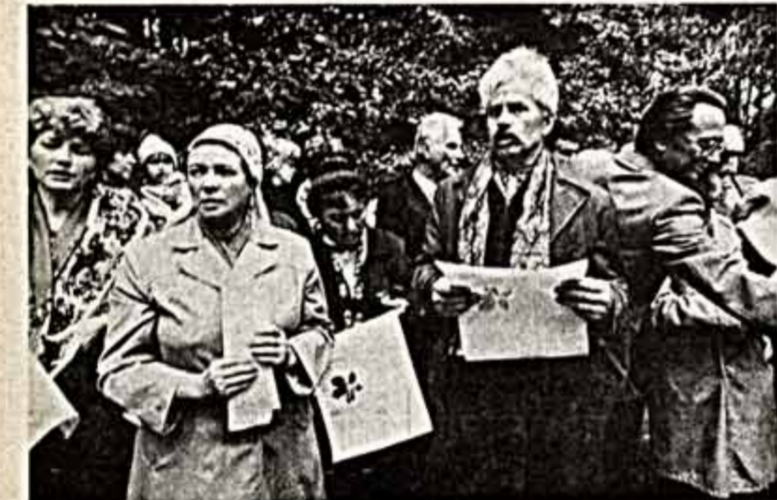
Спектакль под открытым небом