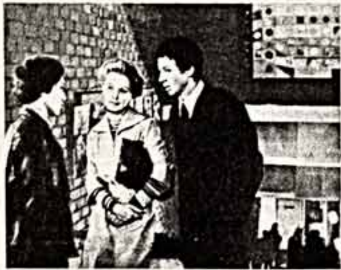
«РАСПИСАНИЕ НА ПОСЛЕЗАВТРА»