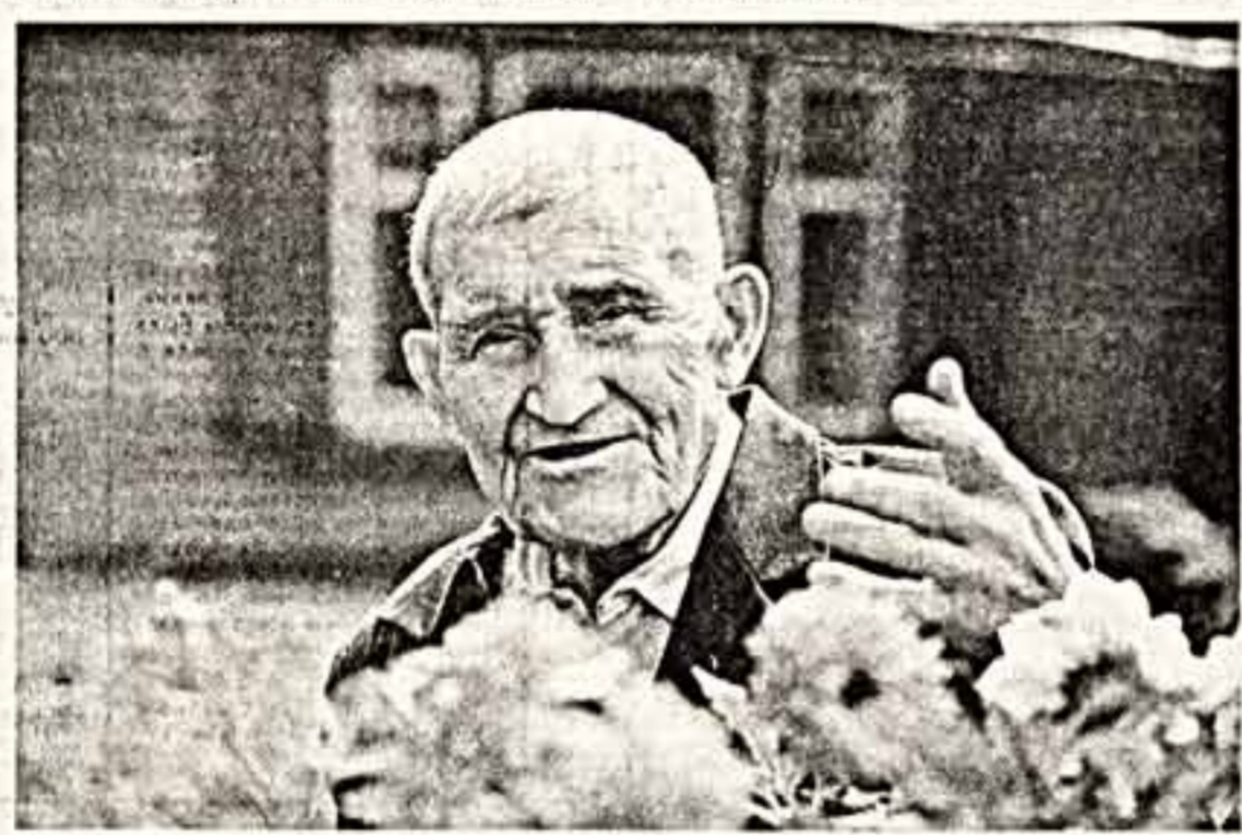
КАЗАНИ.