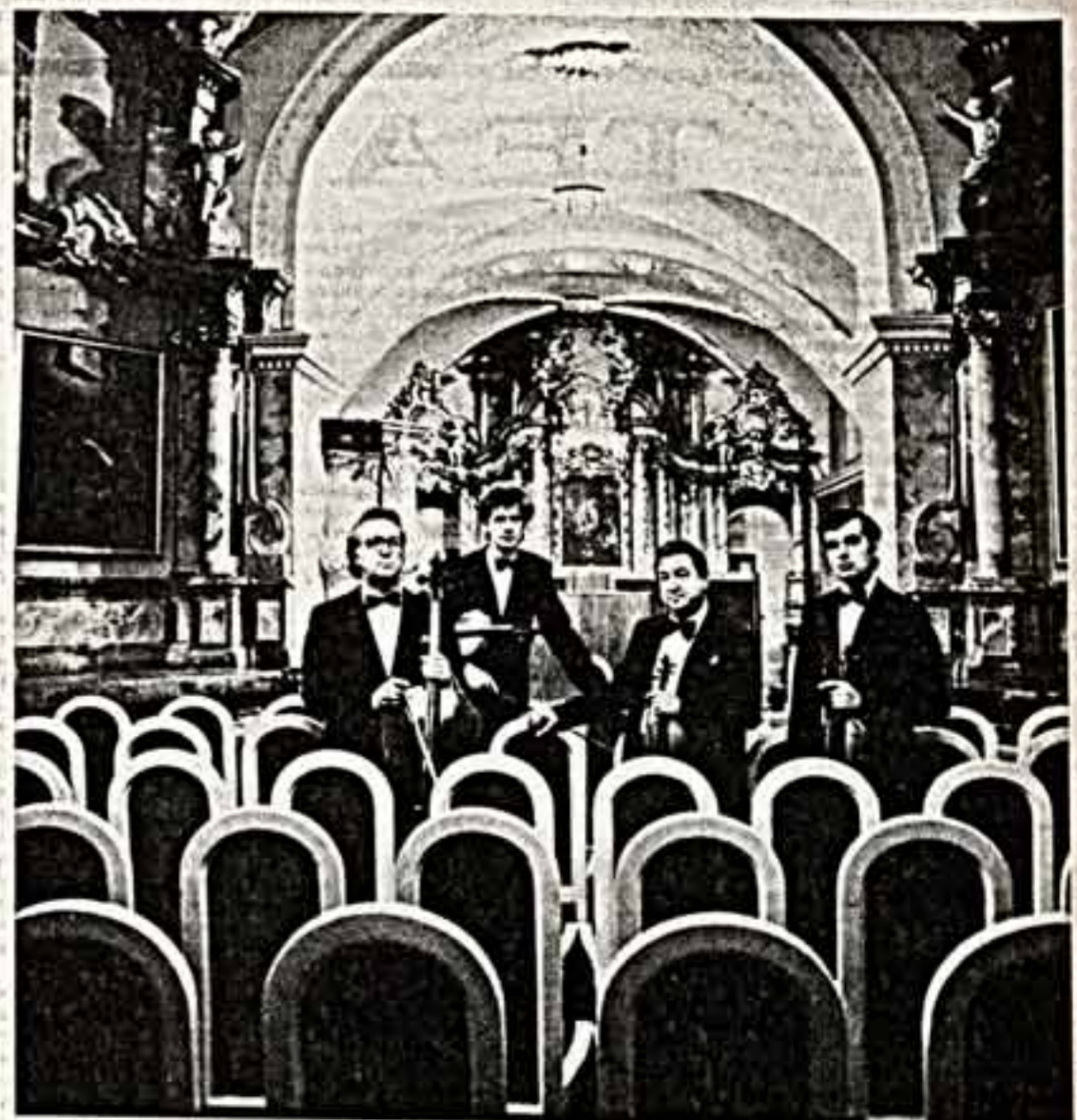
Литовский государственный квартет — заслуженный коллектив республики, лауреат международных конкурсов.