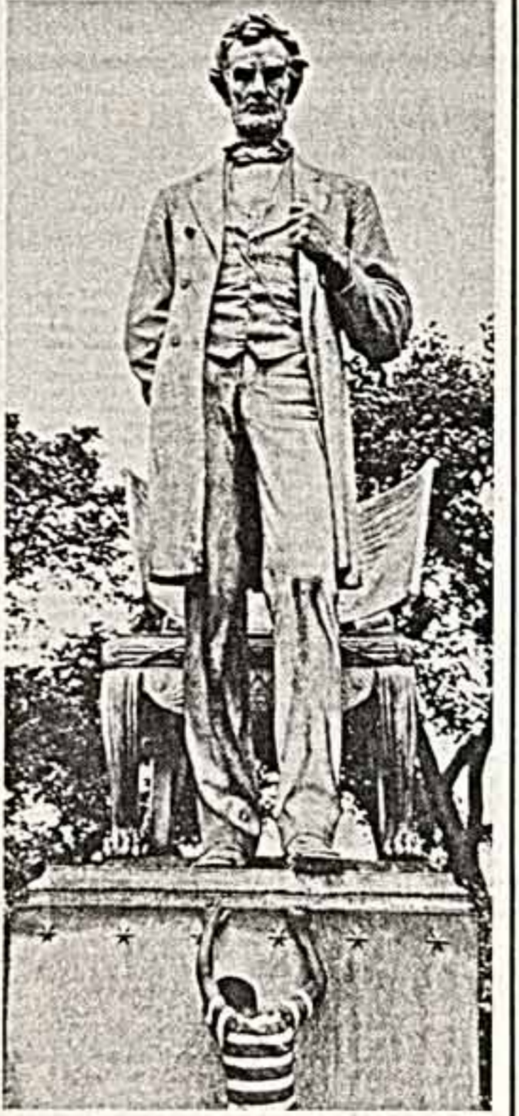
Господин президент, зачем вы ройтесь цветиком в Америке?