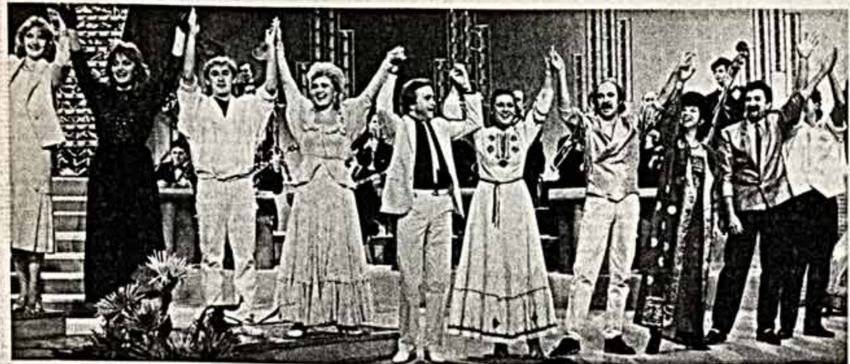
Центральное телевидение подготовило концерт для работников сельского хозяйства «Счастья тебе, земля!». Телезрителю увидят его 15 ноября.