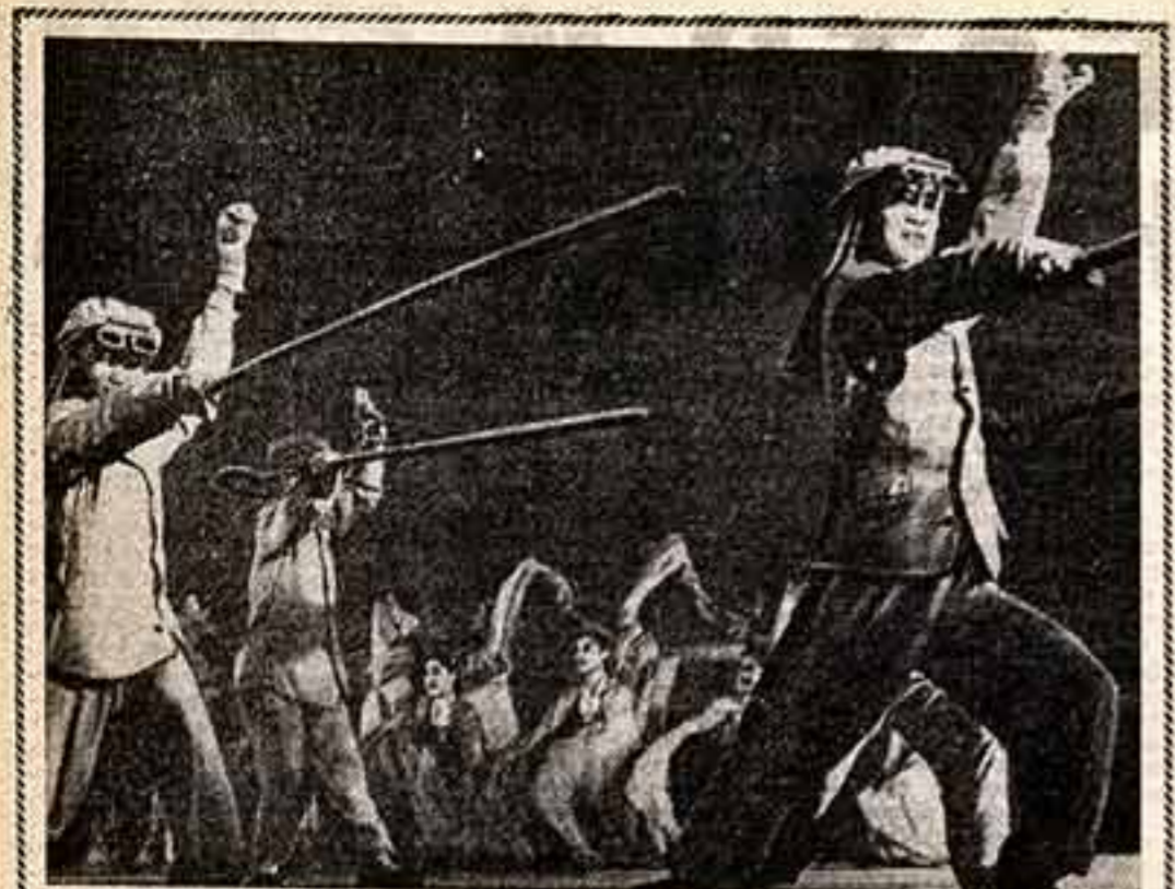
ИРНОЕ И РАДОСТНОЕ впечатление усилили с собой те, кто побывал вчера в Кремлевском театре. Свои первые концерты в столице мастера искусства НИДР Муслим и Женские вокальные ансамбли, солисты театров республик, оркестр народных инструментов познакомили москвичей с богат-