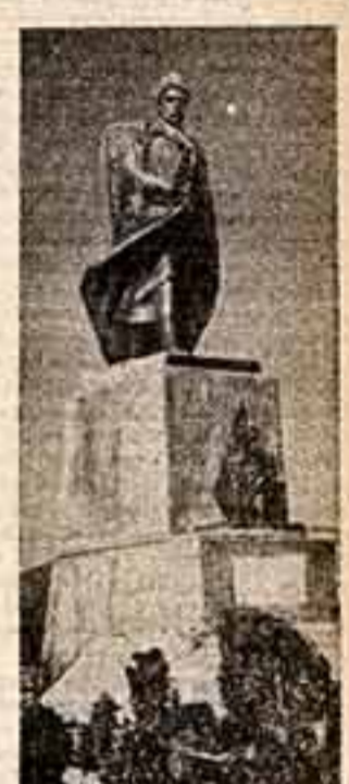
В сале имени Н. Куста Хетагурова Карачевской области открылся памятник великому остеникому поэту-демократу. Делом в бывшем селе Георгиевское-Осетинское, Коста Хетагуров несомненно был, здесь он умер в 1905 году.