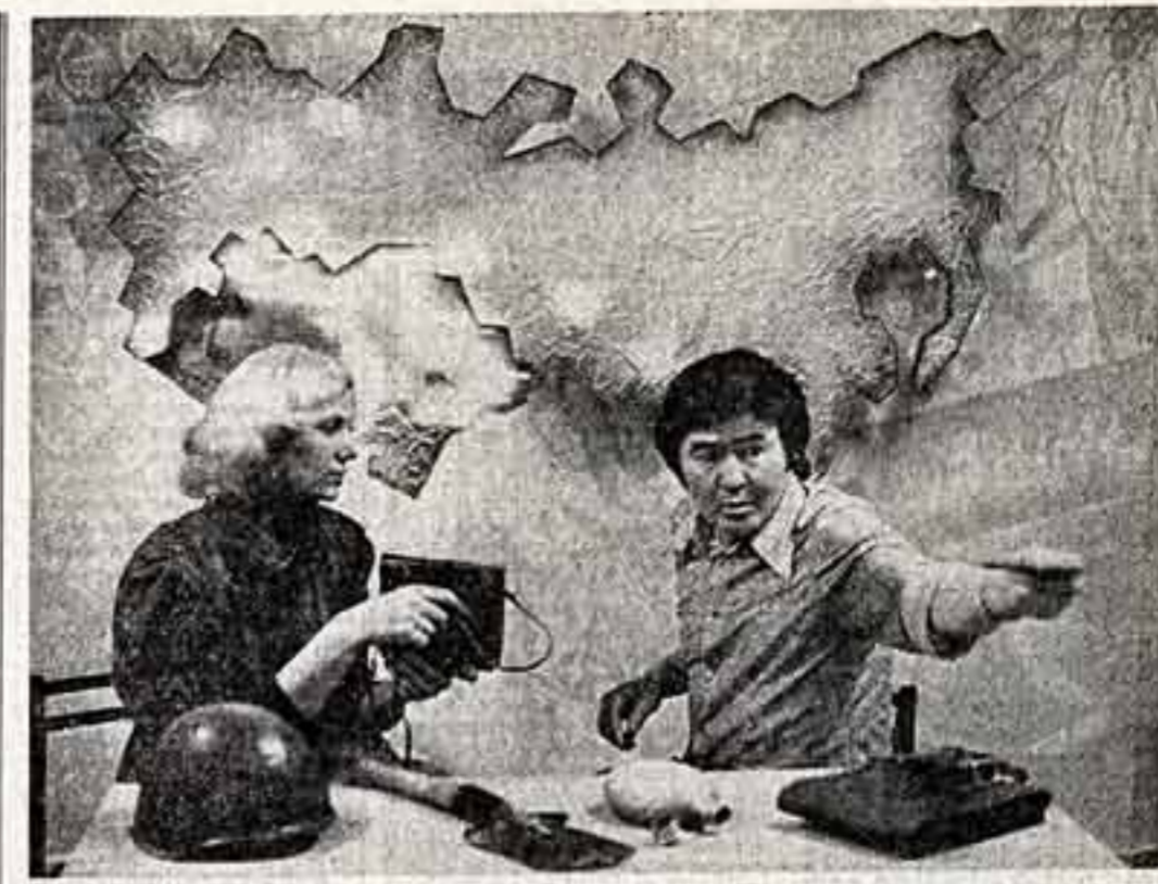
Мангышлакский областной краеведческий музей гостеприимно распахнул двери для посетителей. Музей располагает уникальными предметами домашнего обихода, рассказывающими о жизни и быте казахского народа. Всего в музее около 3.000 экспонатов.