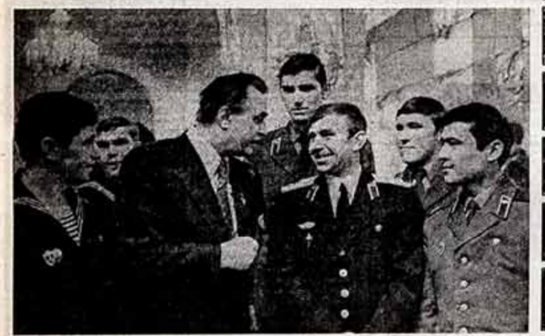
В. СУХОДОЛЬСКИЙ. «Разговор по душам». (Народный артист СССР Евгений Матвеев в отсках у вояк).