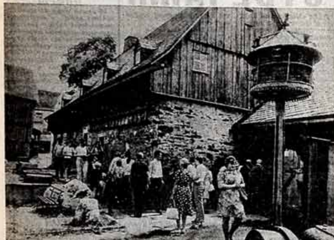
В Музее крестьянского быта, находящемся в Ландовате, на юге ГДР, всегда многолюдно. Здесь собрано почти 4.000 предметов, помогающих создать наглядную картину жизни в немецких деревнях Фогтанда и Рудных гор на протяжении почти 250 лет — вплоть до проведения в 1945 году демократической земельной реформы.