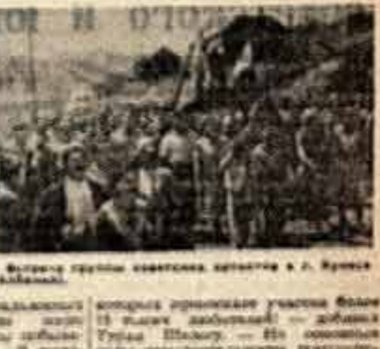
Вечер в театре советских артистов в г. Тирана...