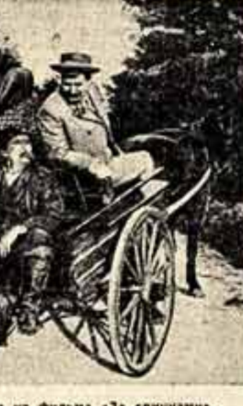
Кадр из фильма «За спячками».

В кинодраме «За спячками» поставленной режиссерами Тойво Сирккя и Юри Норте по сценарию Эриха Нордима, снятой оператором Т. Луукером роман Лассилы обрел новую жизнь. Особенно впечатлительны