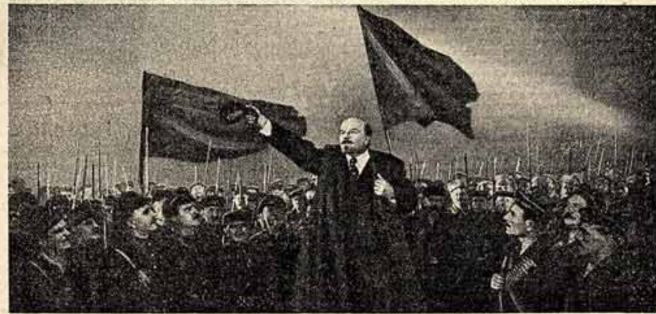
Кадр из цветного широкоэкранный художественный фильм «Пролог».