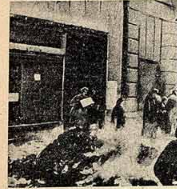
На улицах Будапешта фашисты жгли книги из огня.