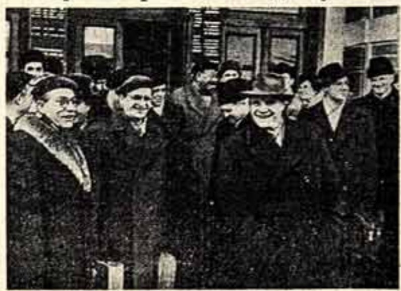
Вчера в Москве в Германской Демократической Республике по приглашению Министерства культуры СССР прибыл Лейпцигский симфонический оркестр «Гевандхауз». На снимке: встреча оркестра «Гевандхауз» на белорусском вокзале в Москве.

Начинающий сегодня в Москве свои концертные выступления симфонический оркестр «Гевандхауз» приезжает в нашу страну впервые.