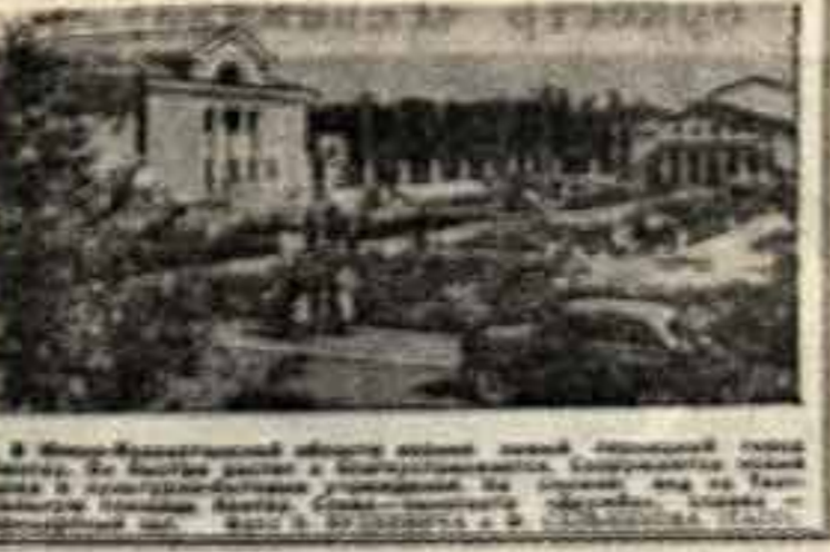
В МБОУ «Молодежный клуб» в Ленинском районе...