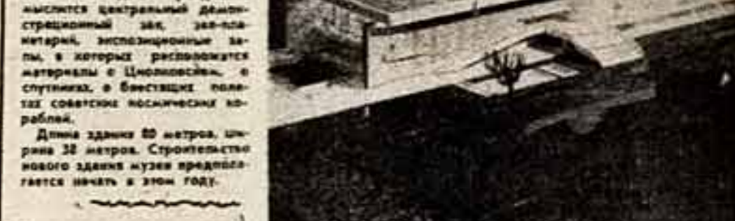
Длина здания 38 метров. Строительство нового здания музея продолжается в этом году.