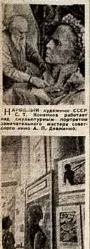
Народный художник СССР С. Т. Колосов работает над скульптурным портретом замечательного мастера советского кино А. П. Довженко.

«СТОЛИЦА КОСМОСА» — так называют Карту, родную великого ученого Константина Эдуардовича Циолковского. Здесь впервые возникла мысль, подтвержденная расчетами, идея полета в межпланетное пространство, в другие миры. И, пожалуй, под стать городу Циолковского будет это светлое, современное здание музея, построенное на месте, где в 1903 году Константин Эдуардович Циолковский, подготовивший первый проект здания музея Циолковского, скончался в возрасте 67 лет в своем кабинете на станции № 3 Министрства путей сообщения РСФСР. Авторы проекта — архитекторы Б. Бегин, М. Орлов, В. Строгов, К. Фельд, Е. Карев, инженеры Р. Пешков, Ю. Рафинский. Здание будет расположено на берегу Оки. Внутрь разделено частью на один этаж, частью на два. Грандиозные масштабы центрального диорамного зала, зал-лаборатория, экспозиционные залы, в которых располагаются материалы о Циолковском, о спутниках, о космических полетах советских космонавтов.