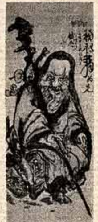
Тэссай Томонка. «Боннет Дазоро, 1914. Водяная краска».