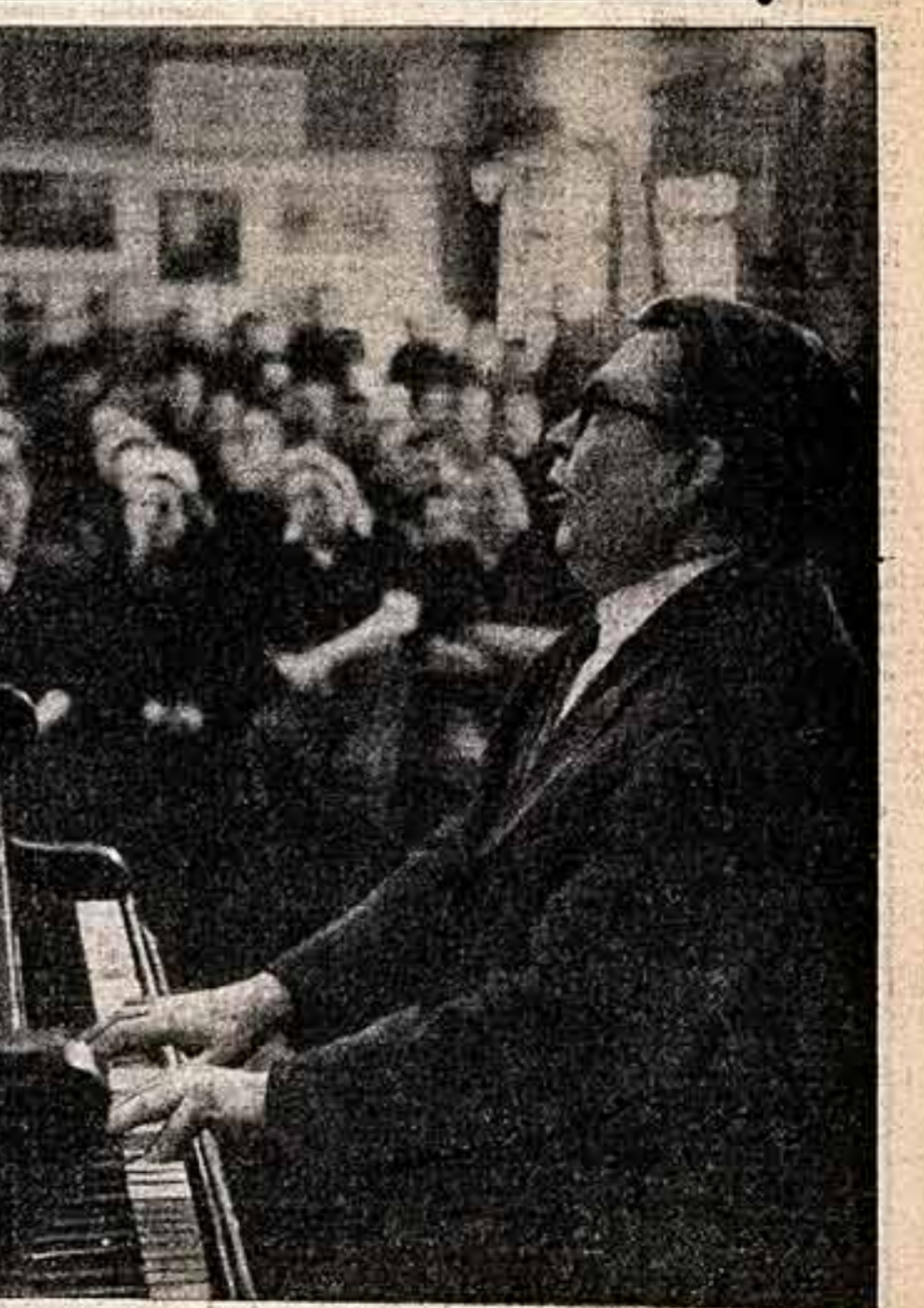
НА СТОЛИЧНОМ автозаводе имени Лихачева каждый день звучит музыка: выступления ансамбля заводских коллективов. Вот и на днях труженники изучили цеховый гимн — «Воспели Павловна Соловьева-Седого».