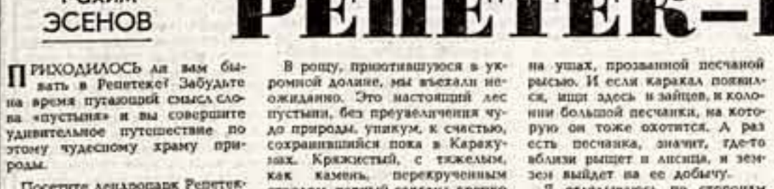
Наш соб. корр. Гомельская область.

ПО СТАРИННЫМ ЭСКИЗАМ Старинная картина, найденная при раскопках в древней крепости, послужила основой для эскиза новой скульптуры.