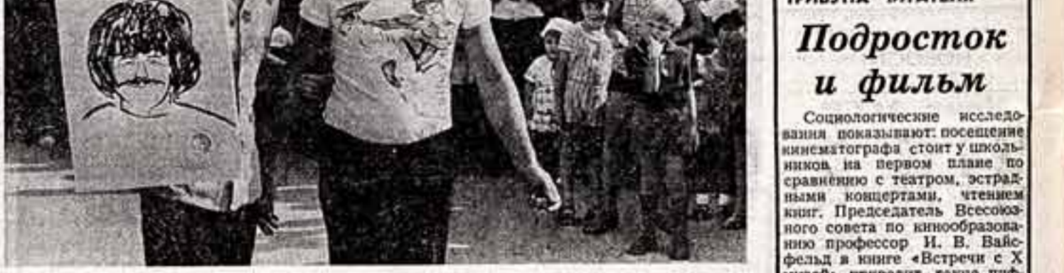
На берегу Каховского моря в Запорожской области раскинулся один из самых молодых и красивых поселков Украинского государства — Энергодор. Здесь живут строители атомной энергомашиностроительной станции.