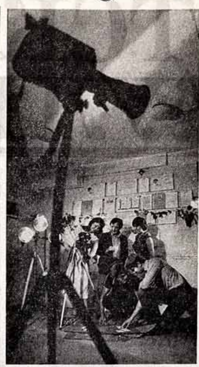
Одним из приватизированных центров города Толмачи является Дворец культуры производственного объединения «Синтез»...