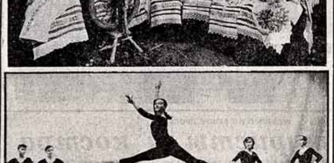
Наш соб. корр. Гомельская область.