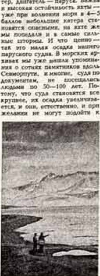
Берега Антарктиды. Разумеется, нас будут интересовать не только памятники, но и люди побережья...