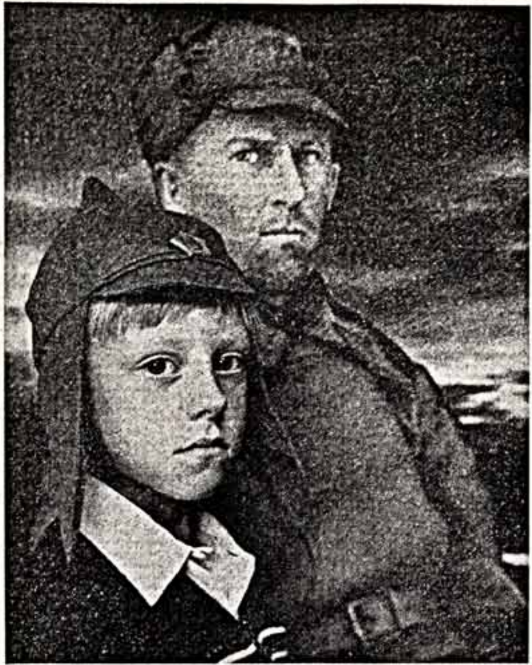
ФОТОКОНКУРС В. БОРИСОВ. «Последние»