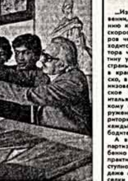
Апрельская революция открыла реальные возможности творческой интеллигенции для практического применения своих сил в таланты. Достойная широкого трудящихся масс стала искусство.

● В студии местного французского художника Гауредика (слева) — одного из основоположников и самых ярких представителей современной армянской живописи. Много времени мастер уделяет работе в холсте.