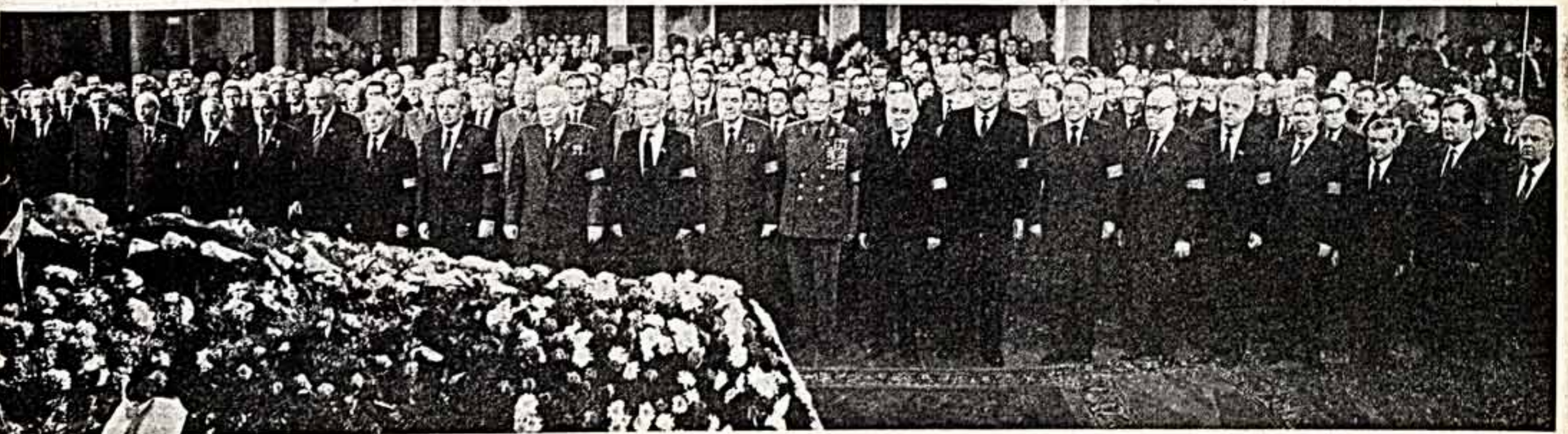
Участники Пленума ЦК КПСС прощаются с Юрием Владимировичем Андроповым.