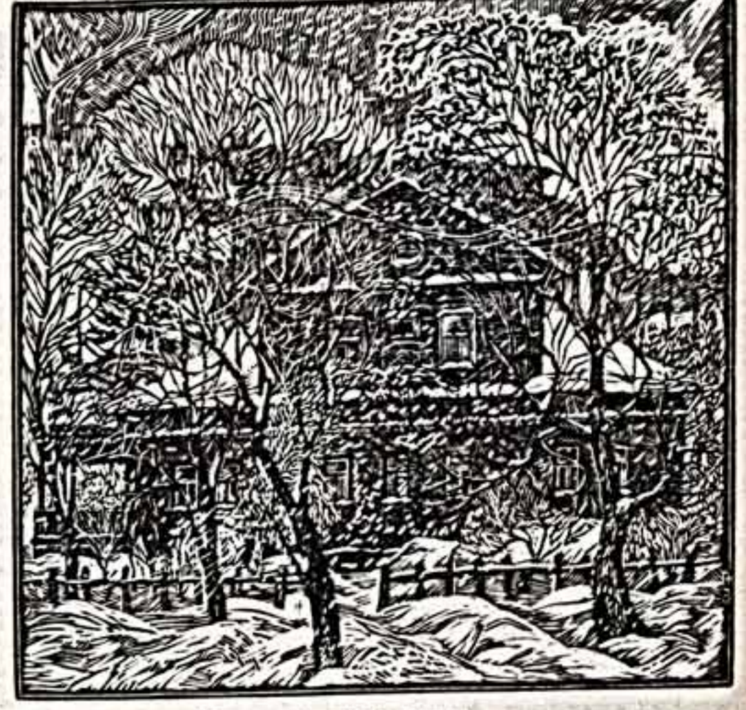
Серебряный вечер. (Литературный музей С. Есенина). Гравюра С. Виноградова.