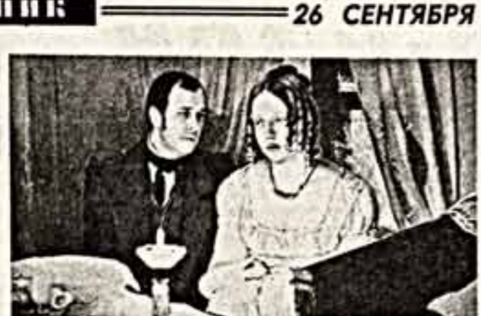
— 2 пр. 13.40. Картина из фильма «Жанитоба». Ленфильм, 1977 г. Автор сценария и режиссер В. Мельников. В ролях: С. Кручинин, А. Петров, О. Ворсков, В. Стрельничкин и другие.