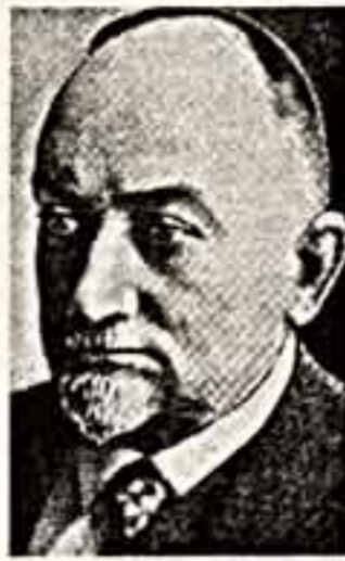
Россиян рассказывает об этой необычной книге и человеке, создавшем ее. Автор передачи приглашает зрителя также на музыкальный вечер в концертную галерею нового музея Г. Чичерина в Тамбове.