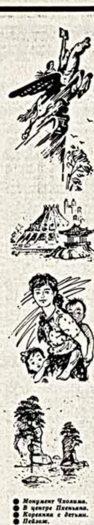
● Монумент Чоюльма. ● В центре Пеньяня. ● Корейка с детьми. ● Пейзаж.