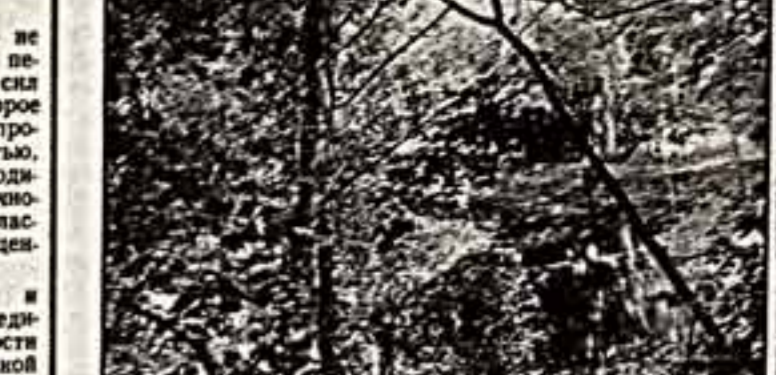
С. КУЗНЕЦОВ. Осень в Ясной Поляне.

большие объемы подписки, у большинства популярных изданий они были уменьшены на 2—5 процентов. Так, в 1988 г. на Москву приходилось 262,9 тыс. экз. «Нового мира»; на будущий год выделено лишь 251,7 тыс. экз.; «Дружба народов» соответственно — 126,2 тыс. экз. и 121,7 тыс. экз.; «Огонек» — 147 тыс. экз. и 129,6 тыс. экз. и т. п. (Практически увеличены лишь тиражи журналов «Москва» и «Аврора»). Ли-