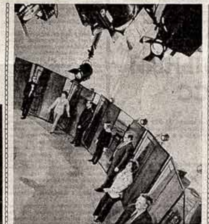
Главная редакция литературно-драматических программ Центрального телевидения готовит к выпуску телефильм «Маленький принц» в постановке Московского драматического театра им. К. С. Станиславского.