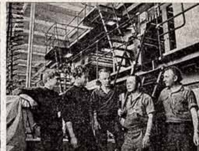
На монтаже офсетно-газетных агрегатов совместно с немецкими специалистами трудятся механики из ГДР.