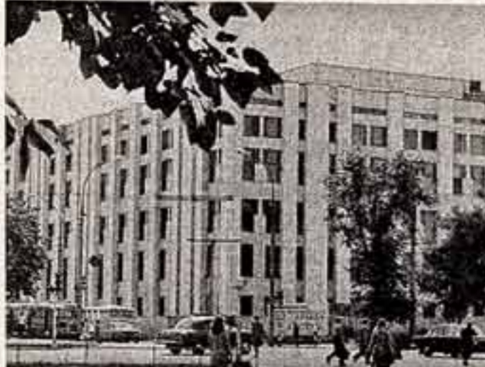
Фасад издательского комплекса «Московская правда».

Наша специальная печатница приобрела опыт на выданных журналах и типографии «Правда», ставящаяся в Германской Демократической Республике.