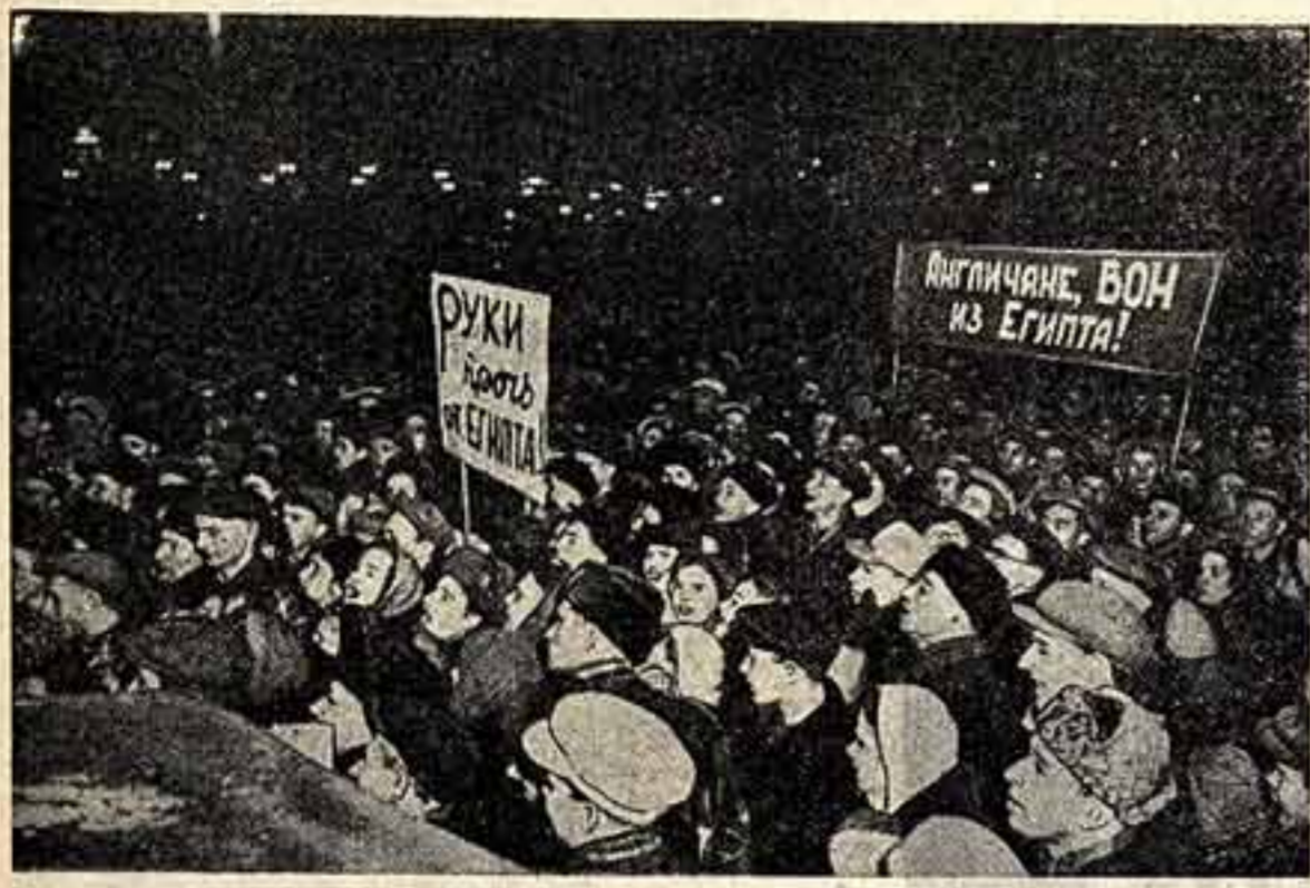
Манифестация трудящихся Москвы у здания английского посольства с требованием прекращения агрессии в Египте.