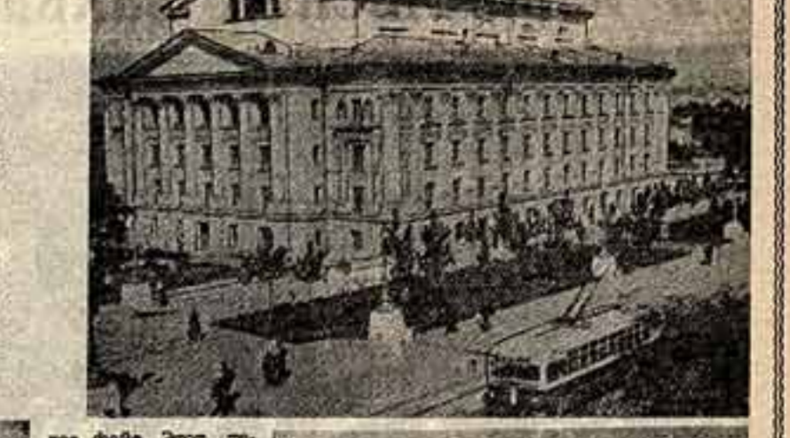
Новые клубы и дворцы культуры получают также гидростроители Братска (Иркутская область), рабочие и служащие Ленинградского металлургического завода имени В. И. Ленина (Молдавская ССР), трудящиеся многих других городов и сел.

Есть произведения красивые, умелые, отмеченные и мастерством, и даже знанием жизни, но сделанные прежде всего для выставок, выставка была конечной целью их авторов. Этого не скажешь о Борисе Пророкове. Он создает свои произведения для жизни и во имя жизни.