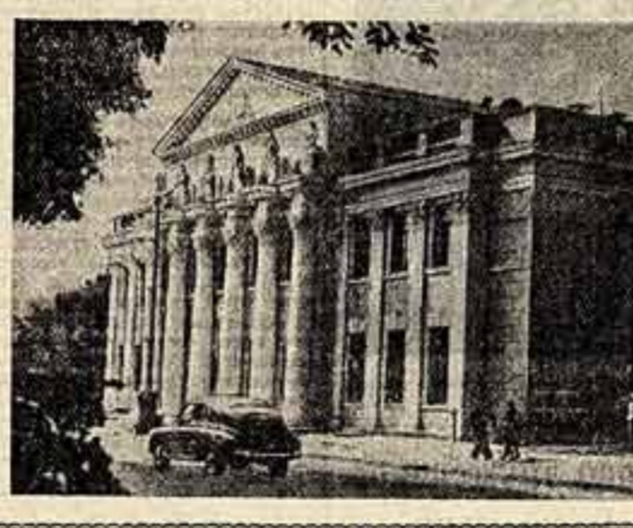
Вот и праздник, большой, торжественный, общенародный и вместе с тем праздник каждого советского человека.

В самом центре Днепропетровска, на площади имени Чкалова, воздвигнут Дворец культуры строителей. В нем большой артельный зал с двумя ярусами, который вмещает восемьсот зрителей, а также комнаты для артистов-любителей, радиоузлы, кинопроекторный, лекционный, выставочный и читальный залы. На нашей фотографии слева внизу — Дворец культуры строителей в Днепропетровске.