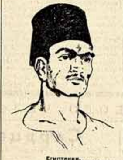
Египтянин. Рис. О. Вережский.

Этот набросок — портрет молодого рабочего из Каира — я сделал год тому назад. Что сейчас с этим красным, гордым человеком? Я видел его в дискуссии толпе, когда кампус праздновал свою большую победу — английские войска оставили священную землю их родины.