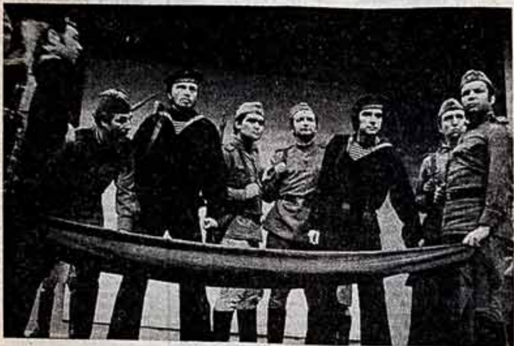
«Советская культура» уже сообщала о том, что в Софийском окружном драматическом театре идет спектакль, поставленный болгарским режиссером Христо Краймаревым по книге всемирно известного Леонида Брежнева «Малая земля».