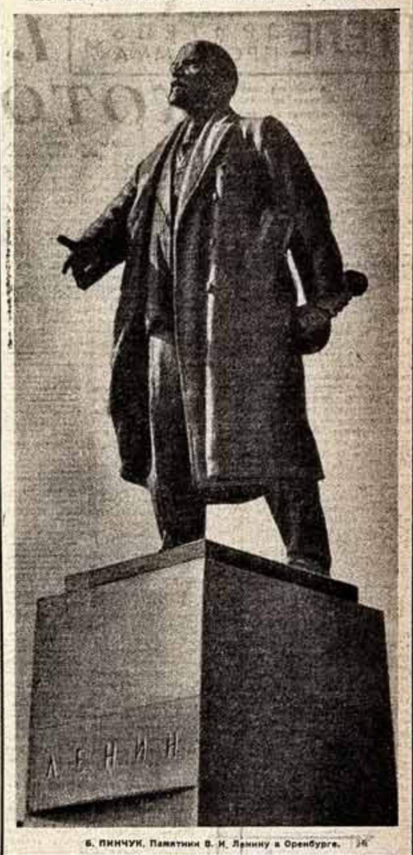
Б. ПИЧУК, Памятник В. И. Ленину в Оренбурге.