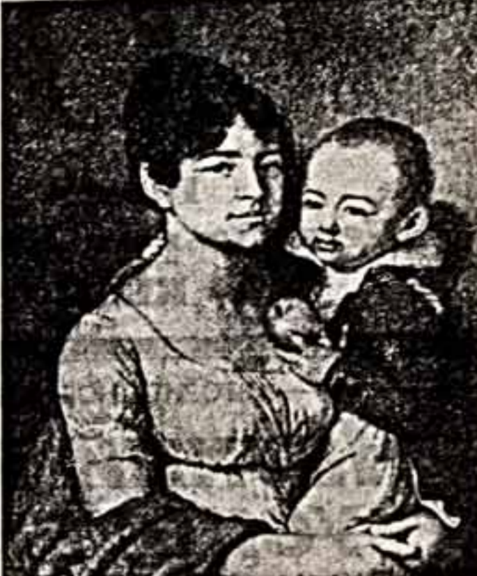
В. БОРОВИКОВСКАЯ. Портрет известной с режиссером.

А что же руководство министерства, которое находится в Квебеке? Тут все на месте: министр, его замы, начальники отделов и их замы и омы и т. д. На днепродзержинском предприятии «Гортепелосет» все доложилось до жалости. Не хватает в нейных рабочих, почти 200 человек. Иначе говоря, недостает главного — тех, кто в любое время года идет в любые магістралы. В свою очередь, техническое воору-