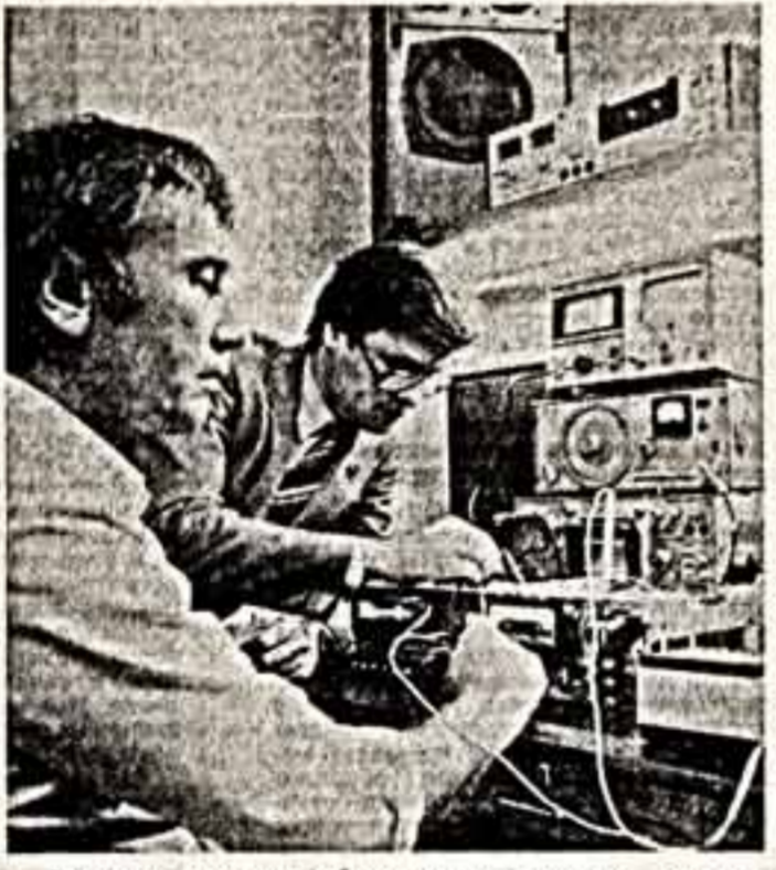
Высокую культуру обслуживания, отличное качество работы обеспечивает новая мастерская на гарантийной ремонтной мастерской «Маяк» в Москве.

Представленные на ней работы советских мастеров, побывавших в творческих командировках в дружественной стране, знакомят с ее успехами в социалистическом строительстве, жизнью простых труженников, с городами и селами Югославии.