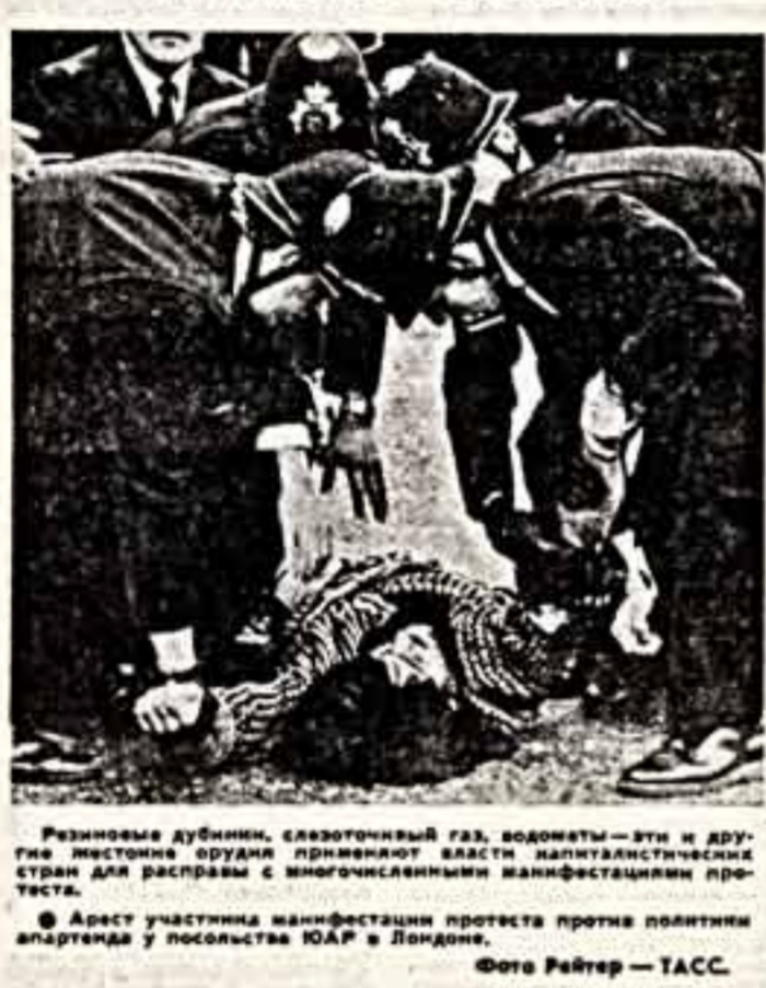
Резиновые дубинки, слезоточивый газ, водометы — эти и другие жестокости органов правды власти капиталистических стран для расправы с многочисленными манифестациями протеста.

М. КАЛМЫКОВ, корр. ТАСС — специально для «Советской культуры».