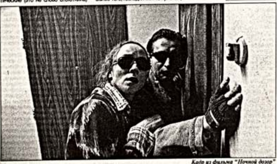
Кадр из фильма "Ночной дозор"

Впрочем, это и понятно - если на экране пустота, то поговорить всегда найдется о чем... Впрочем, это и понятно - если на экране пустота, то поговорить всегда найдется о чем. События же, имеющие место происходят на сцене рокового кинематографического, лиричного подтверждения этой аксиомы.