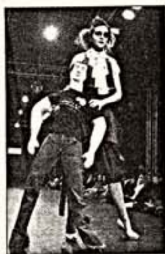
Резной мужчины как аксессуар