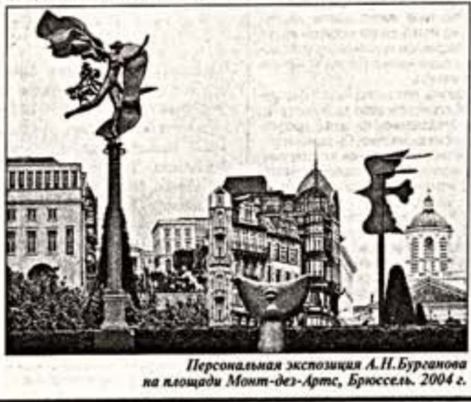
Персональная экспозиция А.Н.Бурганова на площади Монт-дез-Артс, Брюссель, 2004 г.