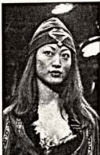
Головной убор от Разуминовой