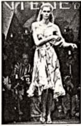
Скромное обаяние подружки-модели

ние сезонных показов в ближайшие тридцать шесть лет для корректировки времени модных показов в России. Более того, к 2050 году в связи с глобальным потеплением на планете предлагается проведение дефиле сезона "осень-зима" неклассическим образом. А в России сложится к тому времени индустрия моды, и все московские сезонные показы объединятся, причем проойдут это гораздо раньше вышесказанной даты.