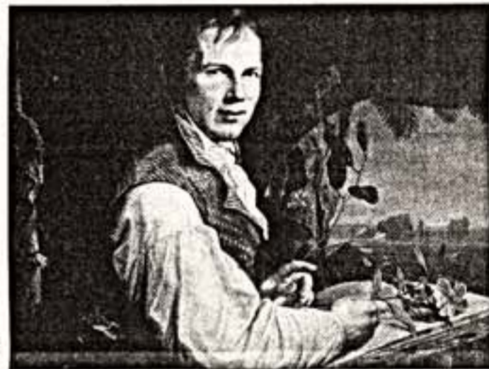
Александр фон Гумбольдт