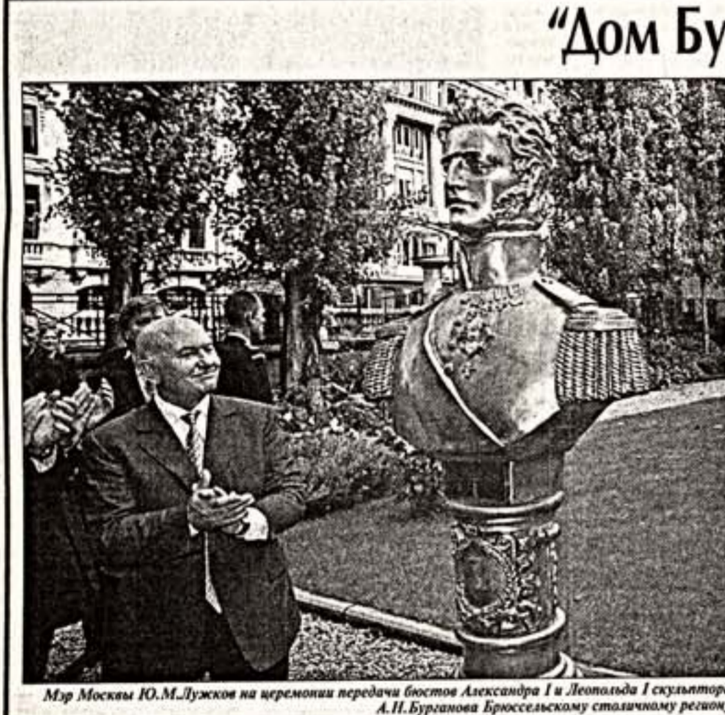
Мэр Москвы Ю.М.Лужков на церемонии передачи бюстов Александра I и Леопольда I скульптору А.Н.Бурганову Брюссельскому столичному региону