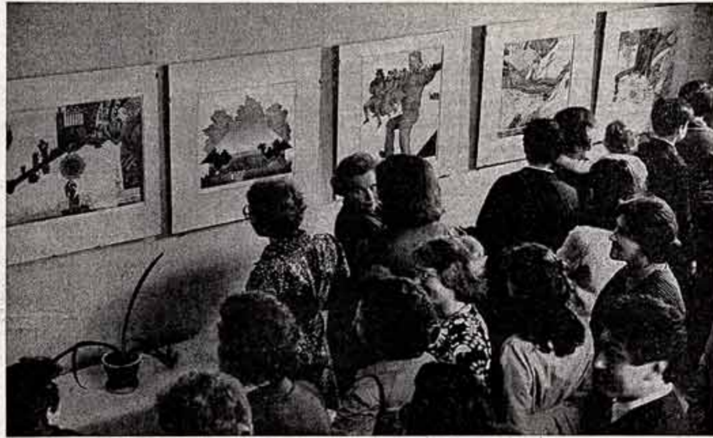
плодотворили морские и шахтеры, рыбопереработчики и лесозаготовители. ● Выступает камерный хор. ● На выставке эстонской советской графики.