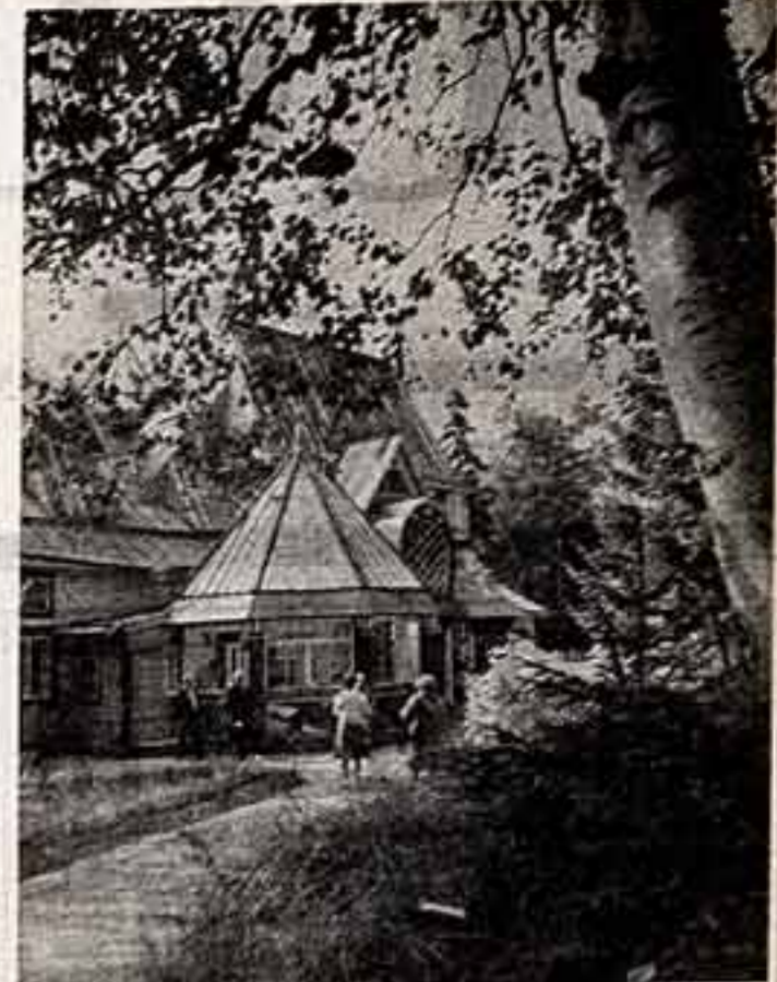
«Пенаты» — усадьба великого русского художника Н. Е. Репина. Здесь живописец жил и работал в течение тридцати лет. В «Пенатах» на знаменитых репинских «террасах» приезжали Ф. Шаляпин и В. Стасов, М. Горький и В. Маяковский и многие другие выдающиеся русские художники, писатели, композиторы.

Литературы стран Азии и Африки неодинаковы по уровню развития. Время возникновения одних исчисляется тысячелетиями, другие появились совсем недавно, с первыми «материалами» для многих видов искусства.