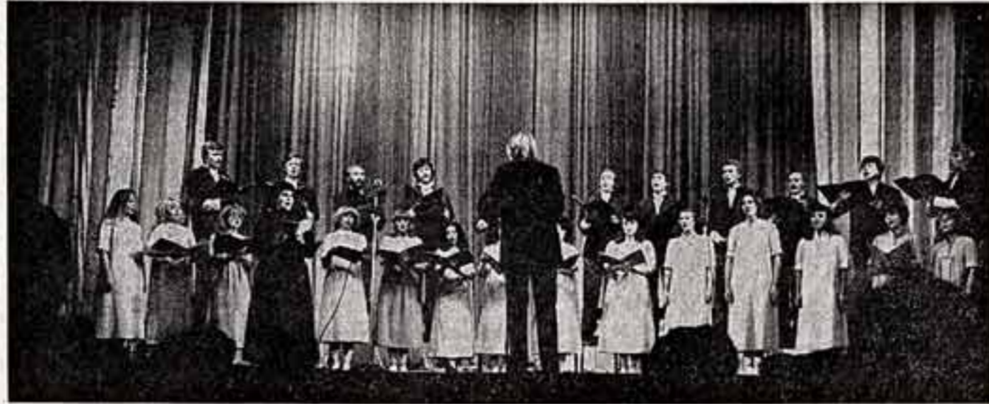
Большой праздник и яркой демонстрацией достижений культуры Эстонской ССР стало открытие Дней искусства республики в Сахалинской области. Посланцев Эстонии тепло встречали во многих городах и поселках острова, им

Произведения, создаваемые мастерами экрана для детей и подростков, способствуют и будут способствовать становлению высоких мировоззренческих и художественных идеалов подрастающего поколения.