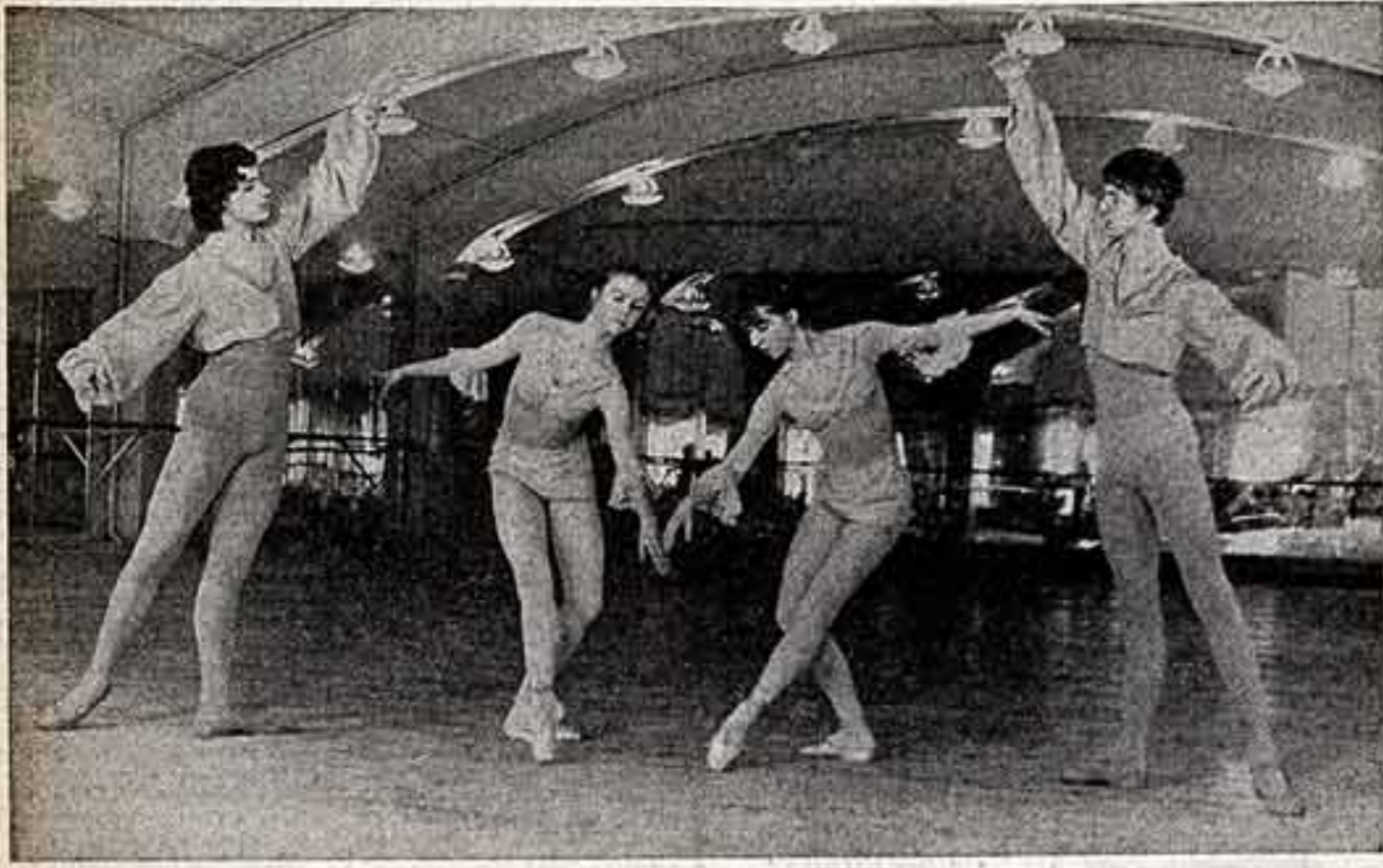
Вот уже около 40 лет сотни вышивальщиц Белорусского государственного хореографического училища развешивают работы в хореографическом коллективе республики и других городов нашей страны.