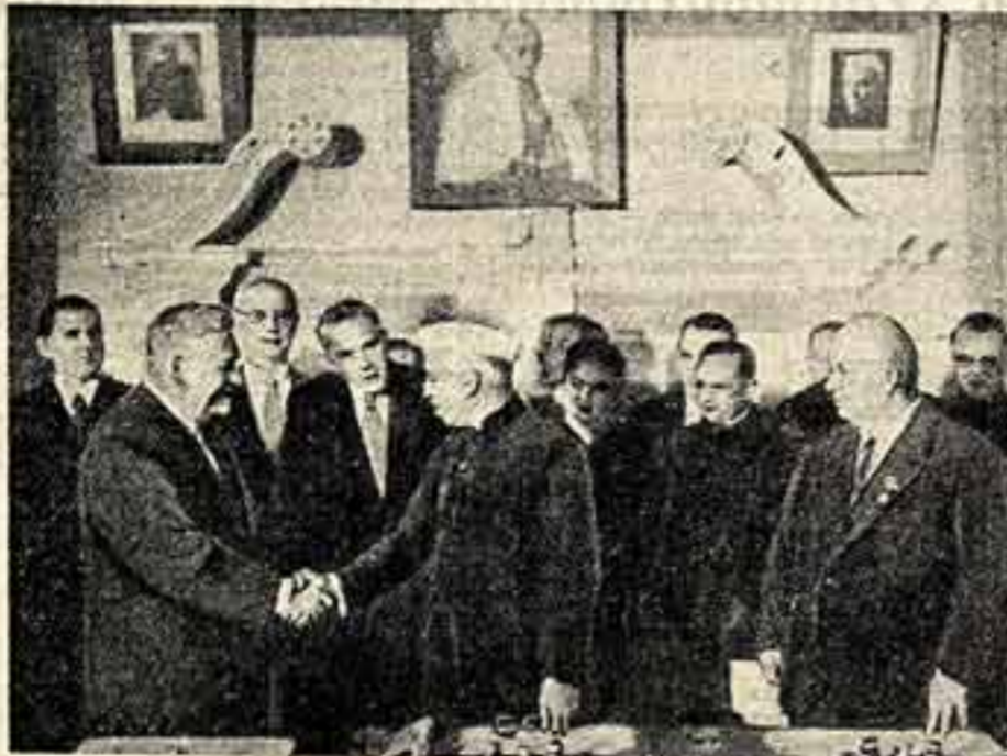
Кадр из фильма «Дружба великих народов». Подписаны Советского Завоевания Н. А. Булганина, Н. С. Хрущева и Джавахарлала Неру во дворце Президента Индии «Раширатри Бхаван».

Но вот стремительно движется фильм как бы замедляется, становится торжественно приподнятым: идут кадры, показывающие посещение Н. А. Булганина и Н. С. Хрущева места сожжения праха великого сына индийского народа Махатмы Ганди.