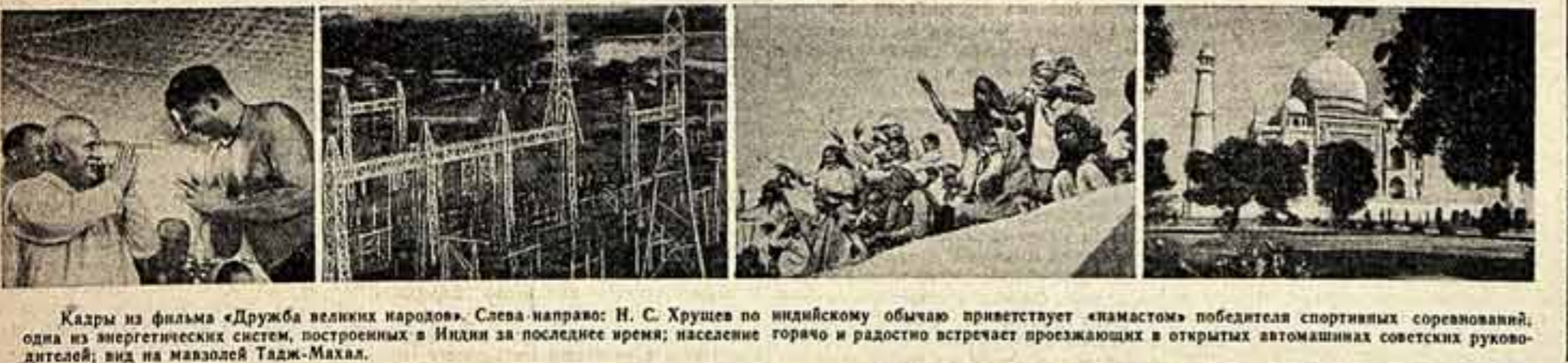
Кадр из фильма «Дружба великих народов». Слева направо: Н. С. Хрущев по индийскому обычаю приветствует «панамом» победителя спортивных соревнований, одна из энергетических систем, построенных в Индии за последние годы; население горячо и радостно встречает проезжающих в открытых автомашинах советских руководителей; вид на мавзолей Тадж-Махал.

Московская букинистическая книга Москва (готора) — Москва, центр. ул. Калуж. 13. Условия покупки устанавливаются по требованию.