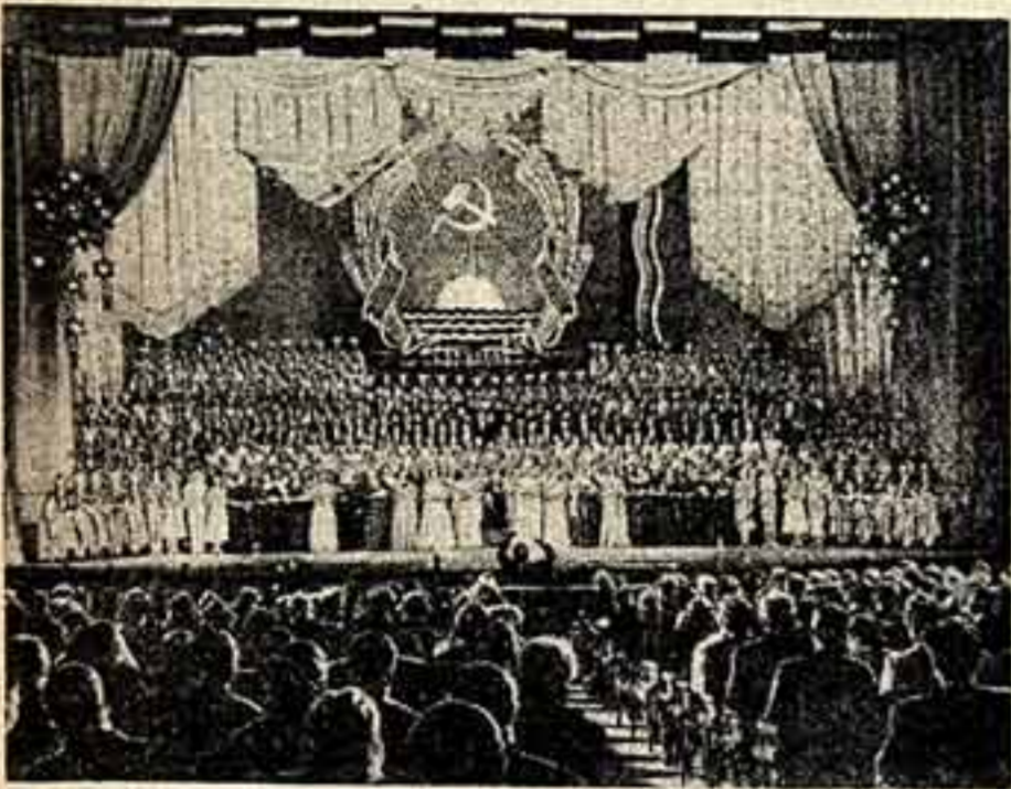
На заключительном концерте декады латышского искусства и литературы в Государственном академическом Большом театре СССР. На снимке: выступление хора, составленного из всех участников концерта.