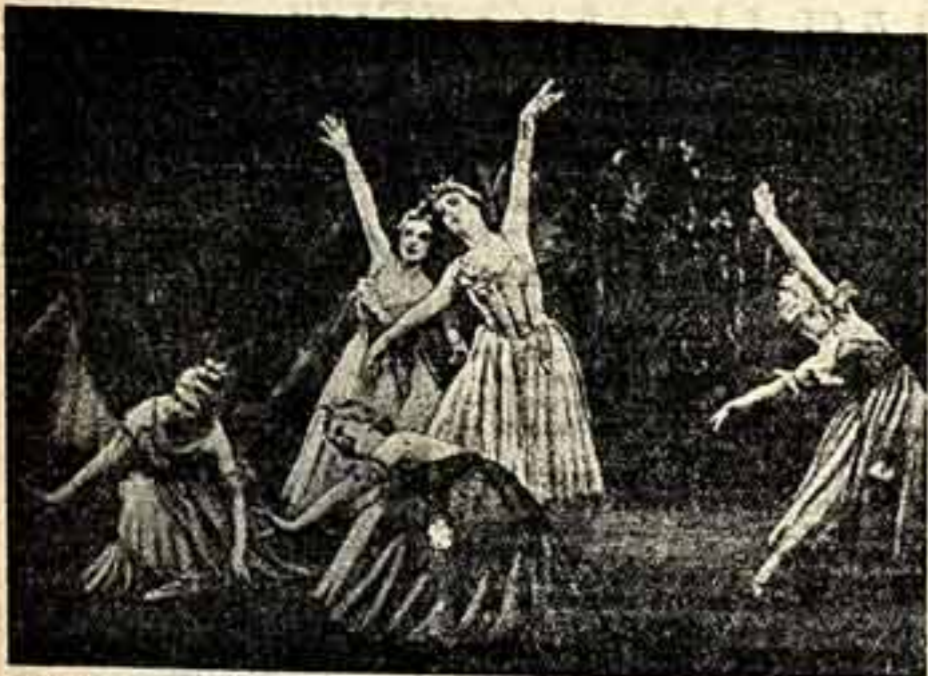
Украинская ССР. В Киевском театре оперы и балета имени Т. Г. Шевченко состоялась премьера балета «Ростислав», музыка украинского композитора Г. Жуковского, постановка народного артиста Украинской ССР В. Бронского. На сцене: сцена из второго действия.