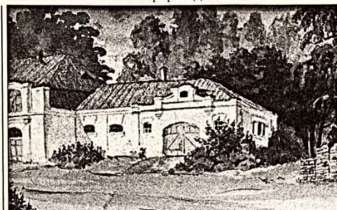
Вверху: "Подмосковье. Протоново. Ковшани", 1917 г. Внизу: "Большево. Сапатовый 'Сосновый бор'", 1940 г.