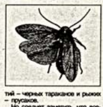
Тараканы появились на нашей планете около 300 миллионов лет назад и до сих пор "традиют" нас своим присутствием.

Тараканы неприхотливы в еде. Они могут не поморщиться съев суюлю трыпку, салоновый крем, крошки хлеба, а заодно и выжить чернила.