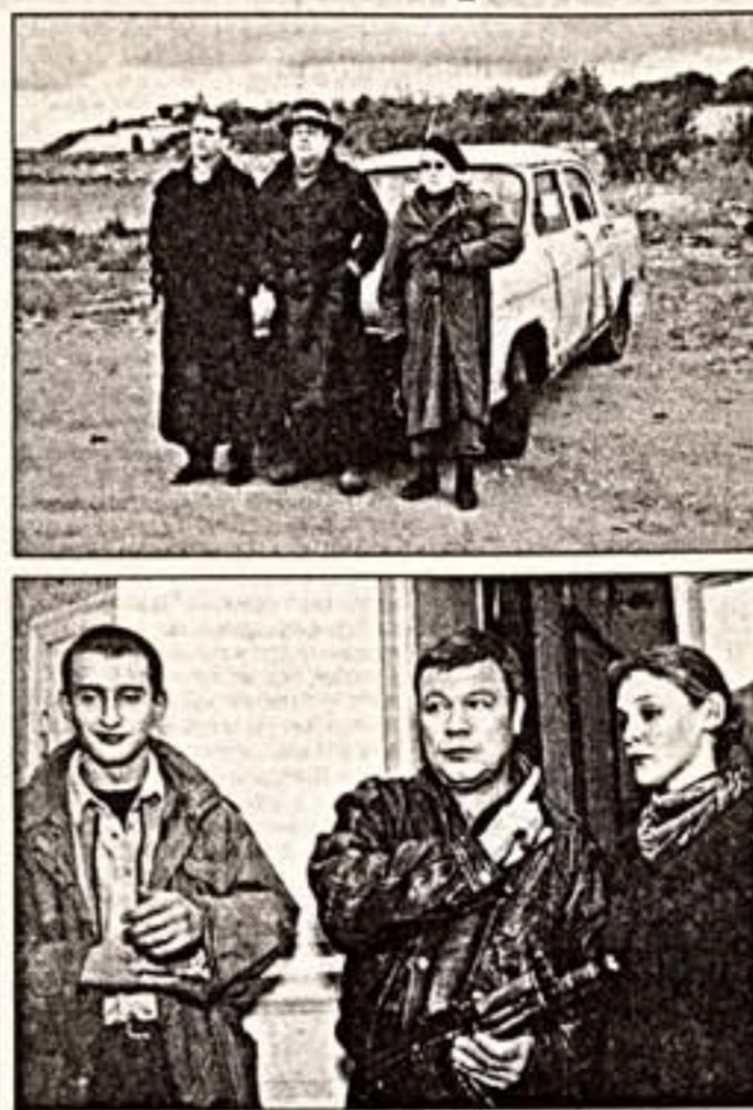
Кадры из телесериала "Убойная сила"