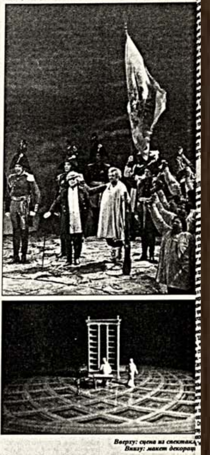
Вверху: сцена из спектакля. Внизу: макет десантника