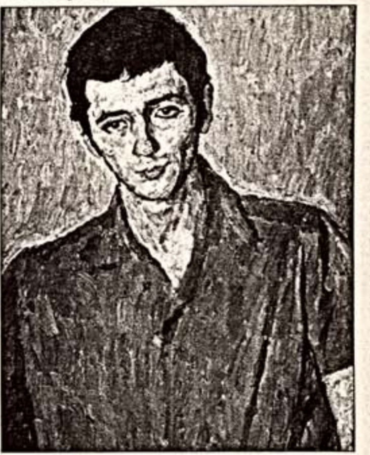
Вверху: "Портрет Степашкина", 1975 г. Внизу: "Натюрморт с сыром", 1992 г.

Народный художник России Альберт Степанович Папикян (1926 — 1997) — из романтического, легендарного поколения шестидесятников, которые неистово и дерзко "переворачивали" наше искусство, отбросили, казалось бы, незыблемые официальные каноны. Он — из шестидесятников и в то же время — сам по себе, оригинальный и неповторимый. Свобода и широта образов, обобщения, колоритное сочетание бурлящих, сочных, ярких и емких красок, простота сюжетов и глубокое духовно-нравственное их осмысление. Это — от шестидесятников? Да. Но также — от древних армянских корней, от национальных традиций, и еще — от русского размаха и удалости.