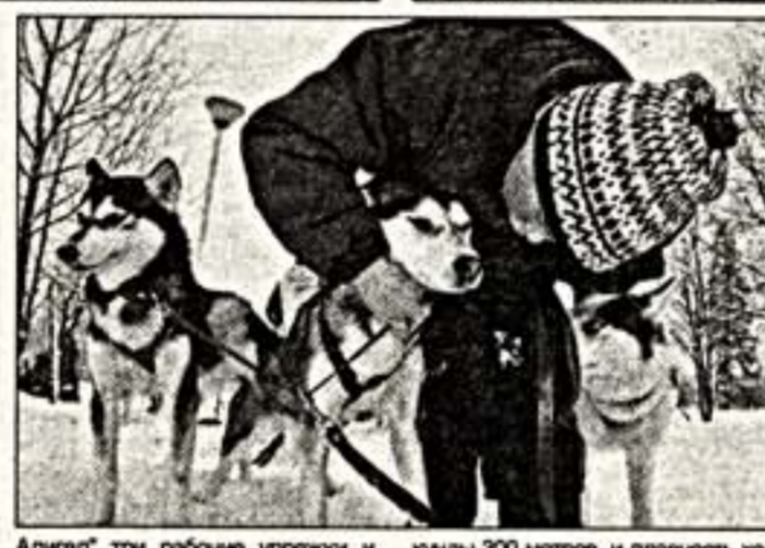
Алигет три рабочие упряжки и только двое нарты.

Про гоним говорят, что это очень дорогой спорт, которым занимаются бедные. Карьеры все деньги вкладывают в упряжку.