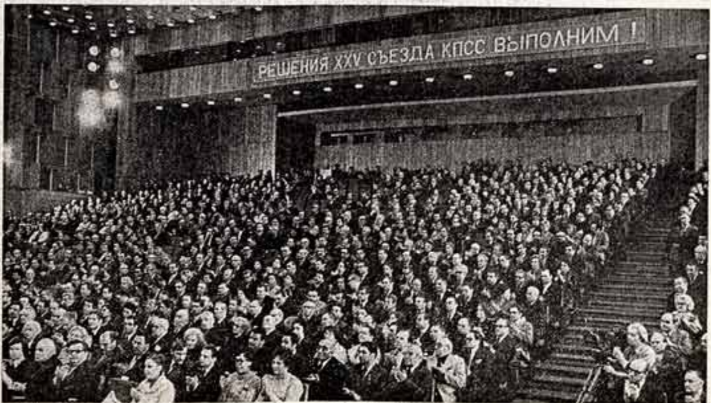
В зале заседаний Всесоюзного совещания работников кино.

Очевидно, что в музыкальном оформлении у нас в последние годы слишком часто появляются «оторванные» от основного штильа, переходящие из фильма в фильм. У нас нет песен, которые сходили бы с экрана и шли в народ, как это было в прошлые годы.