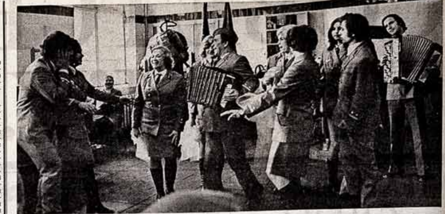
Народному коллективу агитбригады клуба станции Лосиноостровская Ярославского отделения Московской железной дороги исполнилось двадцать один год в этот прославленный коллектив входят рабочие и служащие предприятий дороги и бабушкинского района Москвы.

А. ЧЕРНЕНКО, секретарь Краснозерского района КПСС