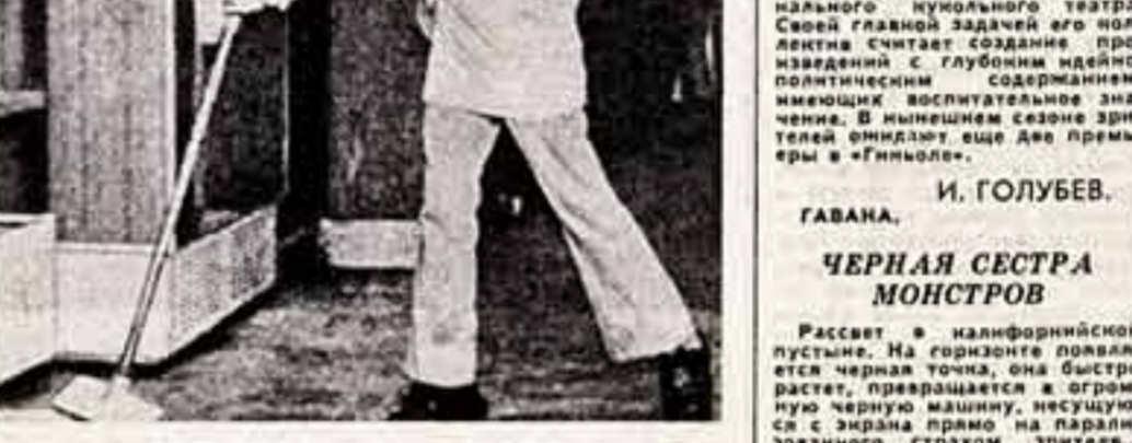
РЕПОРТЕР ОБВИНЯЕТ «Детский труд» — так называется вышедшая в Риме книга, посвященная положению детей в Италии.

«ГНИБОЛО» — 15 ЛЕТ Премьерой спектакля «Гулливер» по книге великого английского сатирика Джонатана Свифта отметил свою 15-ю годовщину национальный театр Мухом «Гнибол».