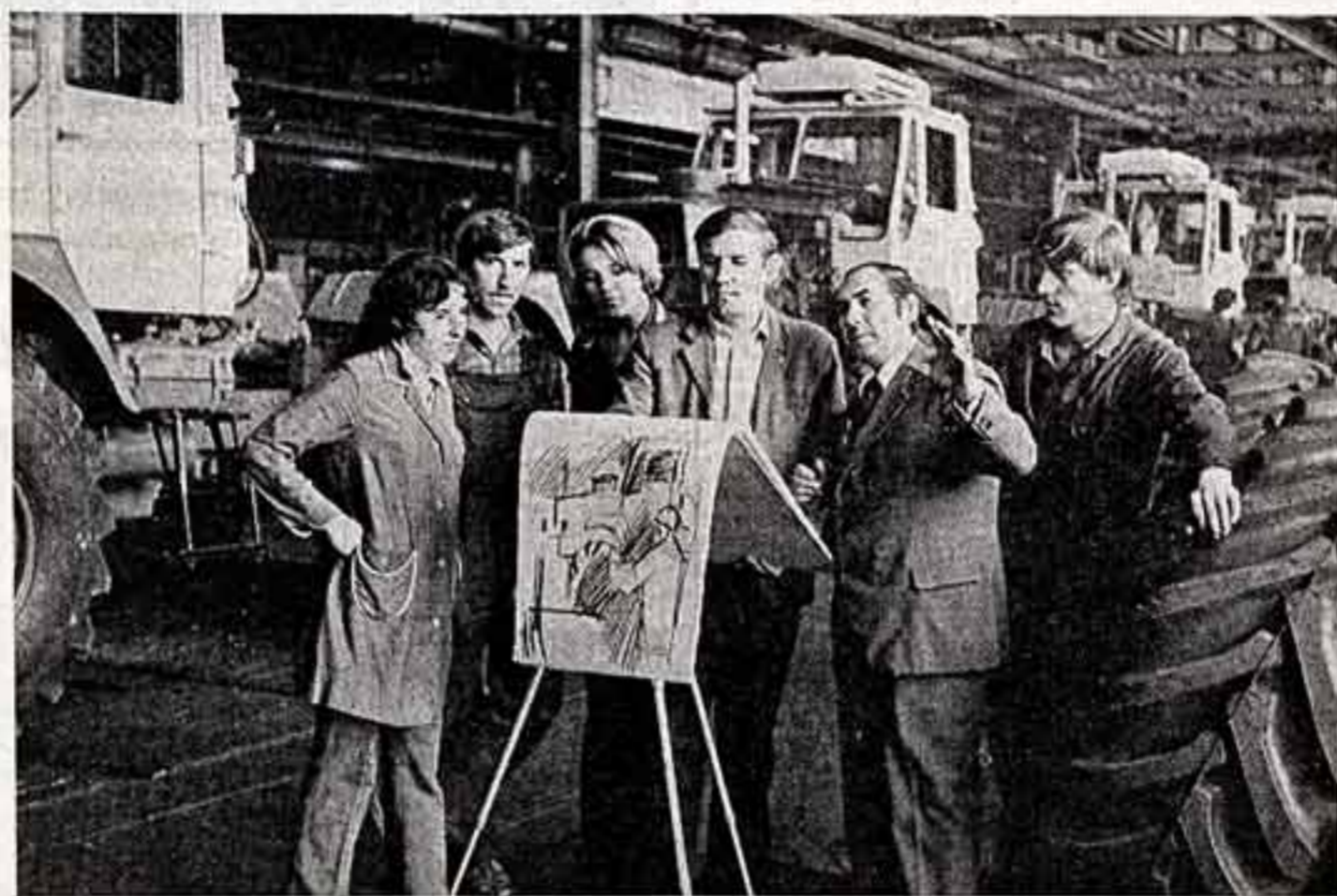
Поэтические «красной субботы»

Подобное положение с театральной сменой нельзя считать далее терпимым. Руководству самих коллективов, как и учреждениям, ведающим на местах вопросами искусства, республиканским министерствам, Министерству культуры СССР необходимо принять все меры к тому, чтобы повсеместно изменить дело к лучшему. Более действенной должна быть в этом отношении и деятельность партийных органов, и в первую очередь партийных и общественных организаций творческих коллективов. Необходимо до конца изжить формализм в проводимой в рамках традиционного двухгодичного смотра работе театров с молодежью. Важно постоянно стимулировать творческую энергию молодых, оказывать всестороннюю поддержку их инициативе. В их творчестве откровенно пропускаям заправный день нашей сцены.