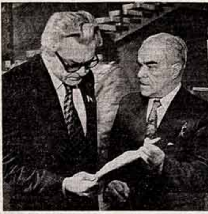
Народные артисты СССР — кинорежиссеры С. Бондарчук и М. Донской. Кинодокументалисты — народный артист СССР Р. Кармен и заслуженный деятель искусств РСФСР Н. Гутман.