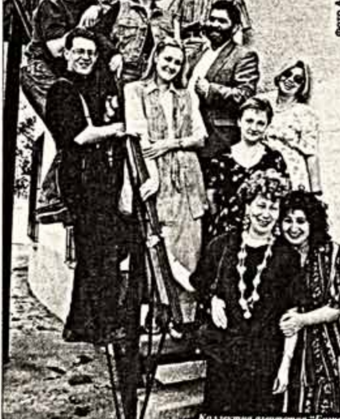
Кто такая Галина Богалубова?