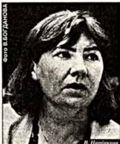
Божий мир был цел и гладил на него...