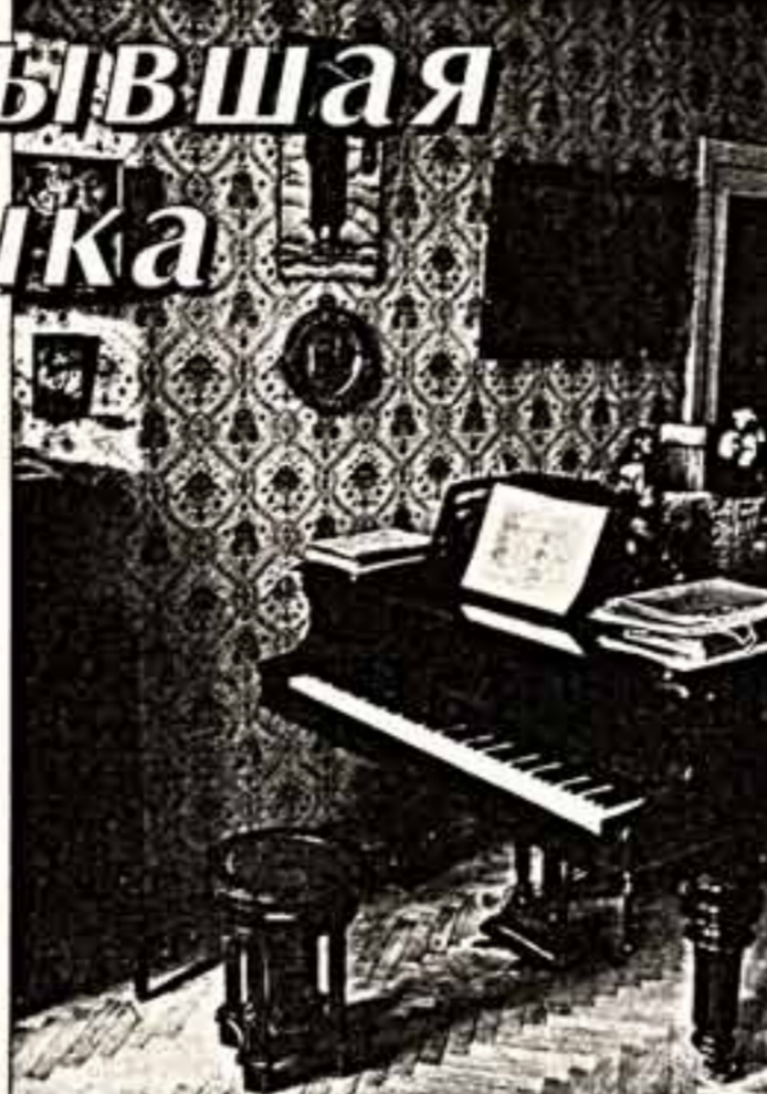
Всего того, что издано, накоплено великой русской музыкой.

Вы обслуживаете и музыкантов неконсерваторцев. Причем, таких читателей очень много. С какими проблемами вы сталкиваетесь?..