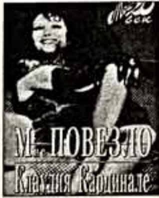
В этой длинной красоте с классическими параметрами фигуры...