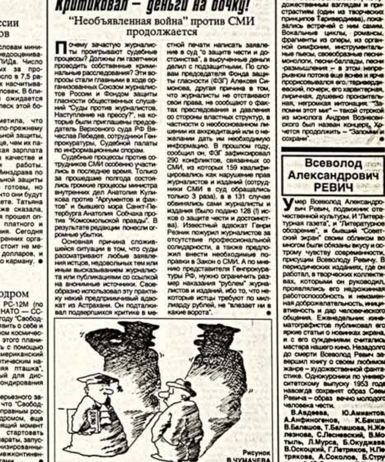
Рисунок В. ЧУМАЧЕВА

Чуть больше года прошло с того момента, как Президент РФ Борис Ельцин подписал указ о создании космодрома "Свободный" на базе одной из расформированных дальневосточных дивизий ракетных войск стратегического назначения.