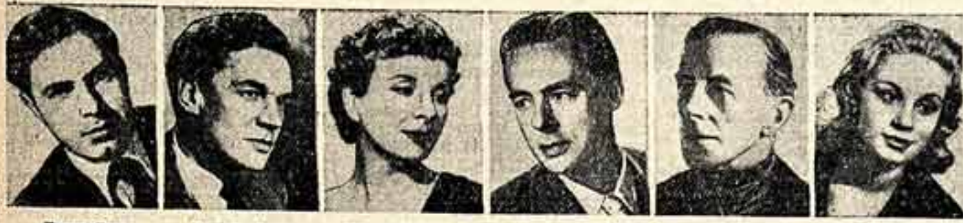
Петер Брук. Под Скоффал.