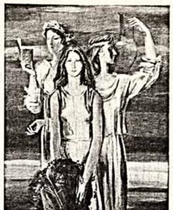
В. КОРНЕЕВ. «Песни отцов». (На сцену). С. ГРЕЧАННЫЙ. «Лето».