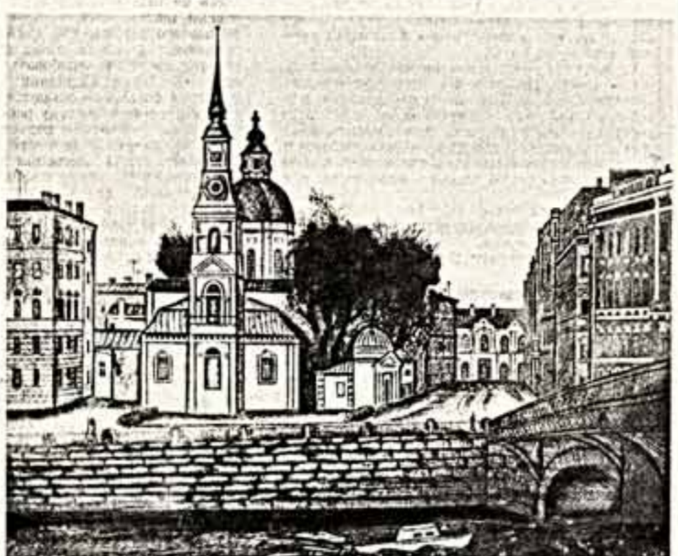
В. ПЕРМЯКОВ. Набережная реки Карповки и набережная реки Фонтанки.