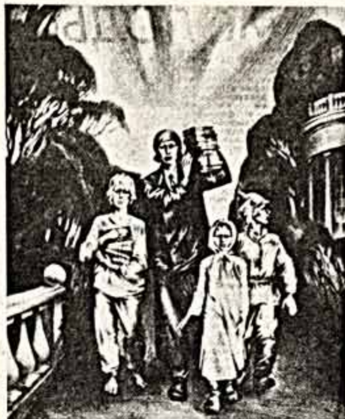
В Киеве с большим успехом продолжает работу республиканская художественная выставка, посвященная 70-летию Великой Октября.