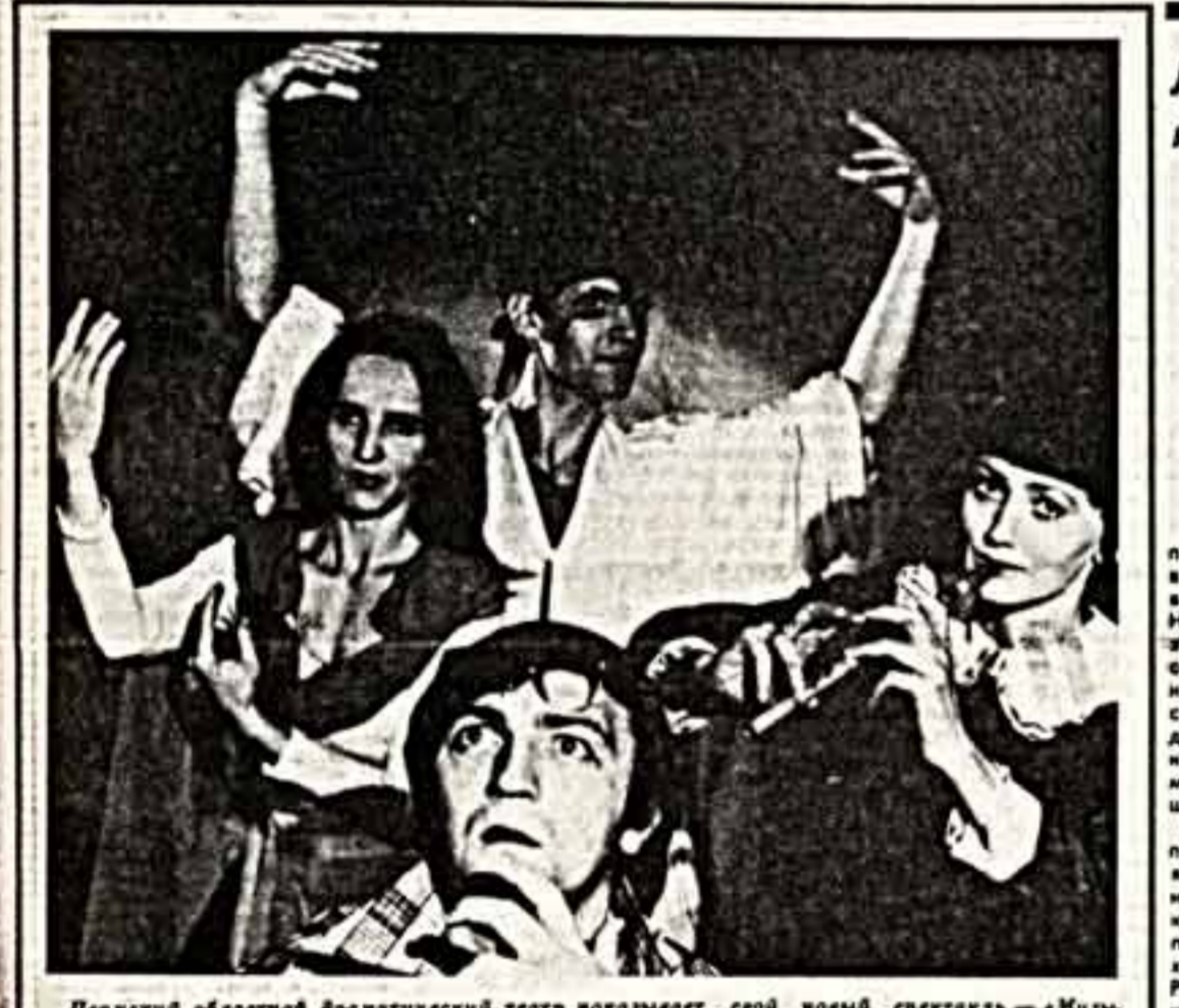
Первый областной драматический театр показывает свой новый спектакль — «Музыкалы» В. Гурьяна. Постановка заслуженного артиста РСФСР В. Гильбура, художник Г. Давыдов, музыкальное оформление Н. Шаронова, хореография Т. и В. Шилова.