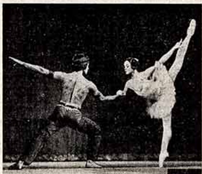
она — Аурора или Флорина в «Спящей красавице», в через несколько дней — Кармен. Или в один вечер мы видим ее в классической «Палитре» и в эротической танца «Исламская миниатюра».