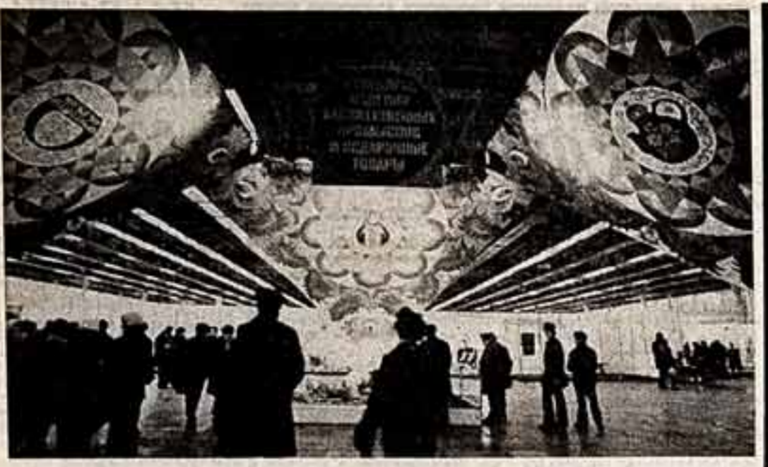
Восьмьдесят тысяч экспонатов собралось на ВДНХ на выставке «Сувениры, изделия художественных промыслов и современные товары». Сажовары и книги, ковры и значки, посуда и игрушки и многое другое представляло на выставке специалисты и зрители. Лучшие образцы товаров поступают уже в этот год в торговую сеть.