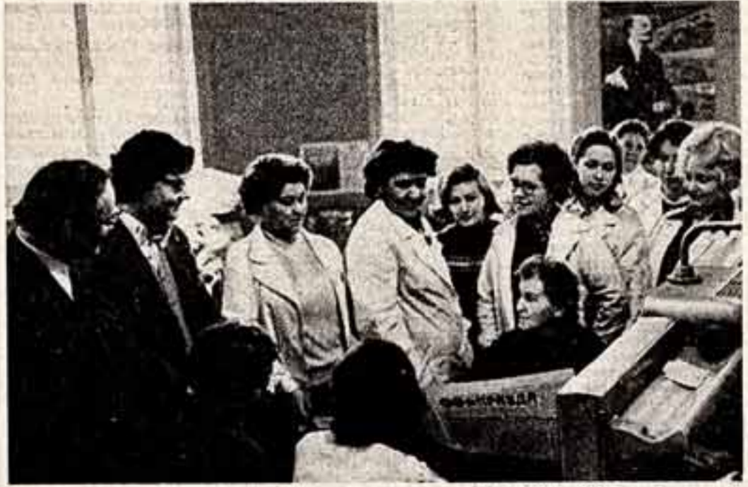
С большим воодушевлением восприняли постановление ЦК КПСС «О 60-й годовщине Великой Октябрьской социалистической революции» на Центральной студии документальных фильмов. Здесь создается серия фильмов, которые составят кинологический фильм «Страна Советов».

Е. ГОГОЛЕВА, народная артистка СССР, Герой Социалистического Труда.