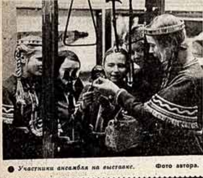
Участники ансамбля на выставке.