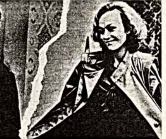
Кадр из фильма.