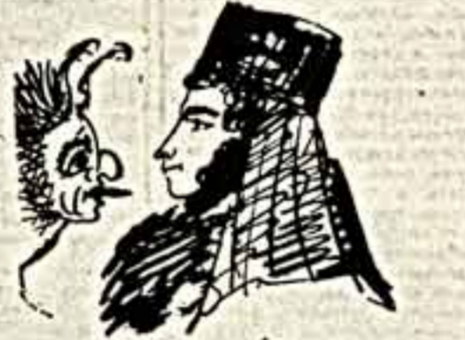
Не искумаи (ла) мену Бур Кудуше