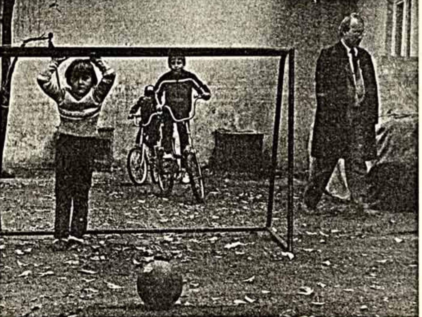
Лето на асфальте.