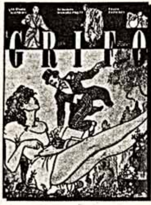
Обложка журнала «Гриф».