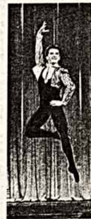
— 1 пр., 12.45.