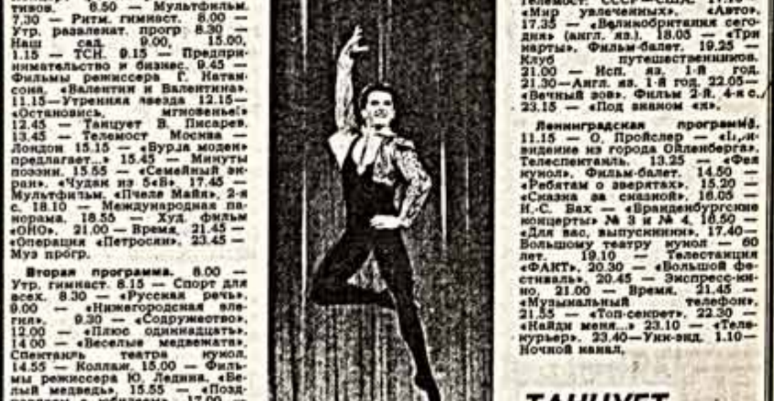
Кадр из фильма.