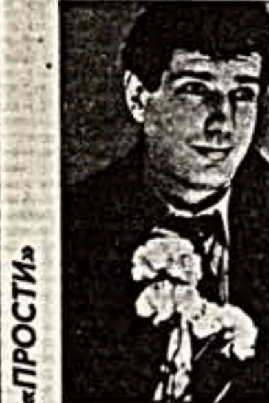
— 1 пр., 21.45.