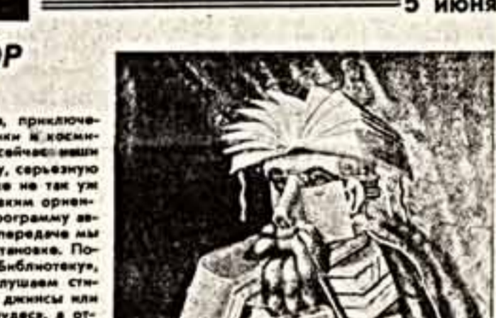
Кадр из фильма.