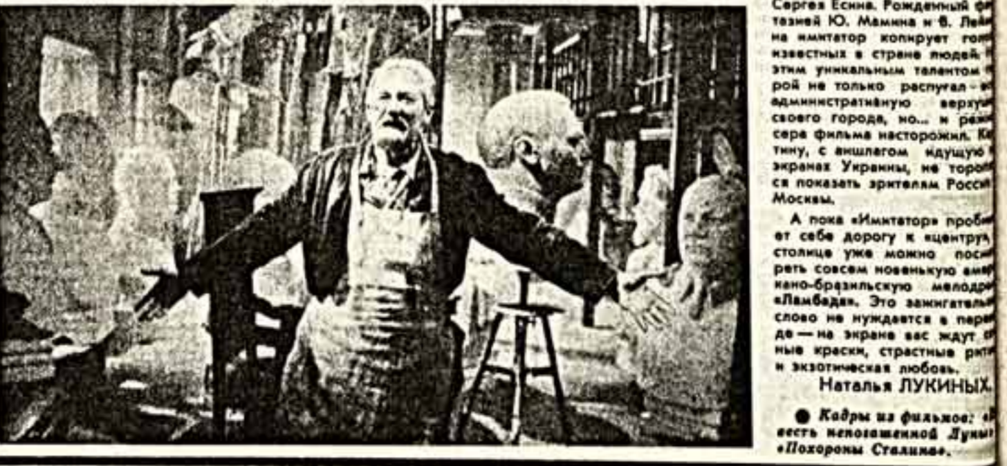
Кадры из фильмов: «Место убийцы в кандалах», «Похороны Сталина».

«Вербовщики». Меня это почему-то интересовало! Ведь представляется, что подобного рода кино (особенно «Вербовщики») рассчитано на массовую аудиторию. И значит, надо, чтобы в области заграничной заглавы проглотили и такую пипилотку, и проглотили.