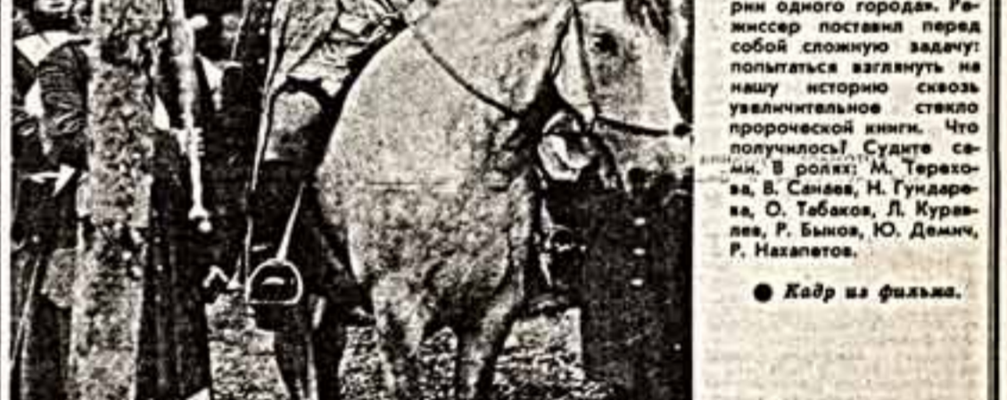
Кадр из фильма.