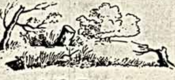
Рисует А. С. Пушкин